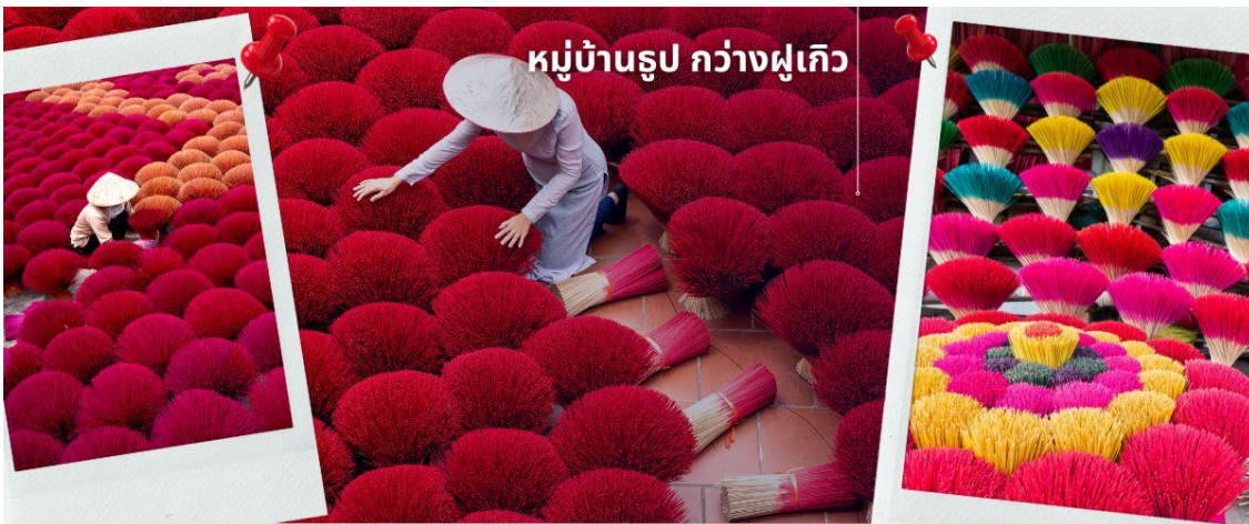
หมู่บ้านรูป กวางฝูเกิว

ย้อมสี ดากแดด และมีกลิ่นคละเคล้าฟุ้งไม้ หรือ ดอกไม้ เอกลักษณะนี้ถูกพัฒนาและต่อยอด จัดแต่งรูปให้เป็นคล้ายสวน ดึงดูดนักท่องเที่ยวให้ไปเยี่ยมชม เรียกได้ว่า เป็นแลนมาร์คใหม่ของนักท่องเที่ยวเลยทีเดียว สลับซับซ้อนราวกับภาพสามมิติ