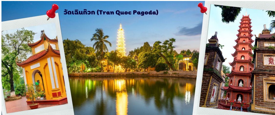
วัดเจดีย์กวัก (Tran Quoc Pagoda)

ผังเป็นอย่างดี ใช้สีสันทึกลับกลืนในโทนสีเหลือง น้ำตาล ตัดกับสีเขียวของต้นไม้ใหญ่ที่โอบล้อมอยู่ ในมุมถ่ายภาพจากอีกฝั่งหนึ่ง จะเห็นสิ่งปลูกสร้างสไตล์จีน และเจดีย์หลายชั้นโดดเด่น มีภาพที่สะท้อนลงสู่ผิวน้ำ เป็นภูมิทัศน์ที่งดงามทั้งยามกลางวันและยามค่ำคืนที่มีการเปิดไฟส่องสว่าง