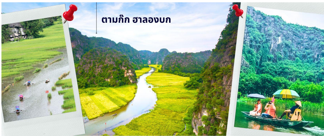
ตามก๊ก ฮาลองบก

จากนั้นนำท่านเดินทางสู่ ตามก๊ก เป็นพื้นที่ที่มีทั้งภูมิทัศน์อันงดงามของยอดเขาหินปูน แม่น้ำหลายสายไหลลัดเลาะ บางส่วนจมอยู่ใต้น้ำ และยังคงล้อมรอบด้วยผาสูงชัน จึงทำให้สถานที่แห่งนี้น่าชม การชื่นชมทัศนียภาพที่สวยงามในจ่างอานนั้น คือการล่องเรือเล็กประมาณลำละ 4-5 คนเพื่อเข้าไปเยี่ยมชมจ่างอาน เรือแจวก็จะพาเราไปเยี่ยมชมวัด หลังจากนั้นก็จะพาเราไปลอดถ้ำ มีทั้งหมด 49 ถ้ำ ซึ่งแต่ละถ้ำจะมีชื่อแตกต่างกันไปจะใช้เวลาล่องเรือไปกลับร่วมสองชั่วโมงเลย ที่เดียว จ่างอานยังถูกเรียกว่า ฮาลองบก เพราะที่นี่มีเขาหินปูนและถ้ำคล้ายกับที่อ่าวฮาลอง