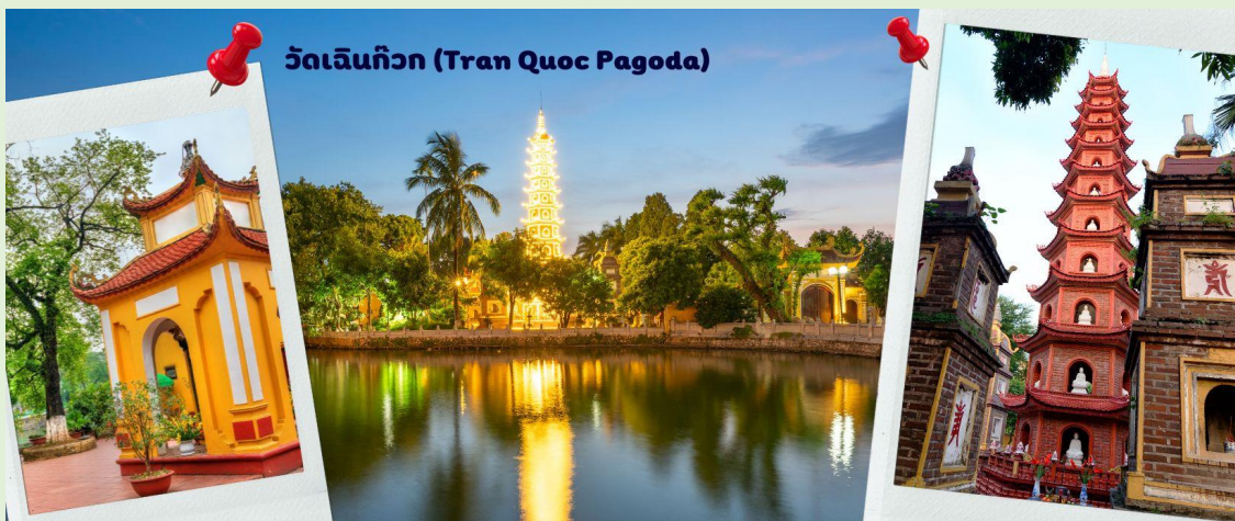
วัดเจินก๊วก (Tran Quoc Pagoda)

จากนั้นนำท่านไป วัดเจินก๊วก (Tran Quoc Pagoda) เป็นวัดที่อยู่ใจกลางเมืองของเวียดนาม ใกล้ชิดกับทะเลสาบตะวันตกของเมืองซานฮอย สร้างด้วยสถาปัตยกรรมจีนโบราณ มีความร่มรื่น และบรรยากาศดี จึงเป็นที่นิยมของนักท่องเที่ยวทั้งที่ชื่นชอบความงามและมีศรัทธาในพระพุทธศาสนา จากภาพมุมสูงของสถานที่ตั้ง ที่นี้เหมือนตั้งอยู่บนเกาะที่ยื่นลงไปทะเลสาบ แต่มีเส้นทางคมนาคมเข้าถึงที่ สิ่งปลูกสร้างมีการวางผังเป็นอย่างดี ใช้สีสันทึกลับกมลกลืนในโทนสีเหลือง น้ำตาล ตัดกับสีเขียวของต้นไม้ใหญ่ที่โอบล้อมอยู่ในมุมถ่ายภาพจากอีกฝั่งหนึ่ง จะเห็นสิ่งปลูกสร้างสไตล์จีน และเจดีย์หลายชั้นโดดเด่น มีภาพที่สะท้อนลงสู่ผิวน้ำเป็นภูมิทัศน์ที่งดงามทั้งยามกลางวันและยามค่ำคืนที่มีการเปิดไฟส่องสว่าง