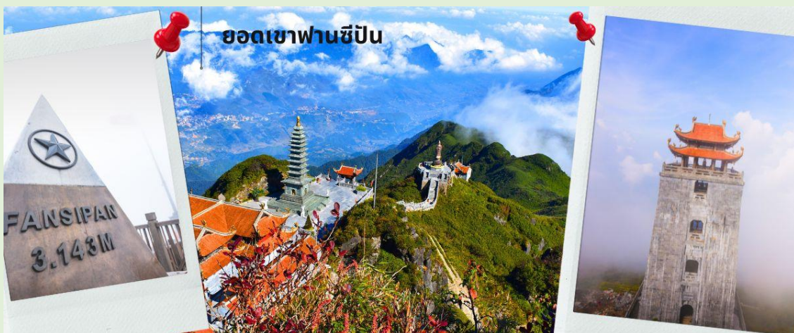
ยอดเขาฟานซีปัน

จากนั้นนำท่าน นั่งกระเช้าขึ้นเขาฟานซีปัน (รวมค่ากระเช้าขึ้นเขา) ข้ามภูเขากว่า 7 กิโลเมตร ใช้เวลาประมาณ 15 นาที ข้ามเทือกเขาหน้อยใหญ่มากมายสู่เทือกเขา ฟานซีปัน ท่ามกลางมวลเมฆหมอกที่ลอยละล่องอยู่รอบๆ ชมทัศนียภาพที่แสนสวยงามบนจุดชมวิวในระดับความสูง 3,143 เมตร จุดที่ได้รับการขนานนามว่าเป็นหลังคาแห่งอินโดจีน ด้วยทิวทัศน์แบบพาโนรามาพร้อมสัมผัสผืนอากาศที่หนาวเย็นตลอดทั้งปี ท่านสามารถเดินขึ้นสู่จุดสูงสุดของยอดเขาฟานซีปัน หรือเลือกใช้บริการรถราง (ไม่รวมรถรางขึ้นสู่ยอดเขาฟานซีปัน) เพื่อพิชิตสูงที่สุดในเอเชียตะวันออกเฉียงใต้ หรือหลังคาแห่งอินโดจีน