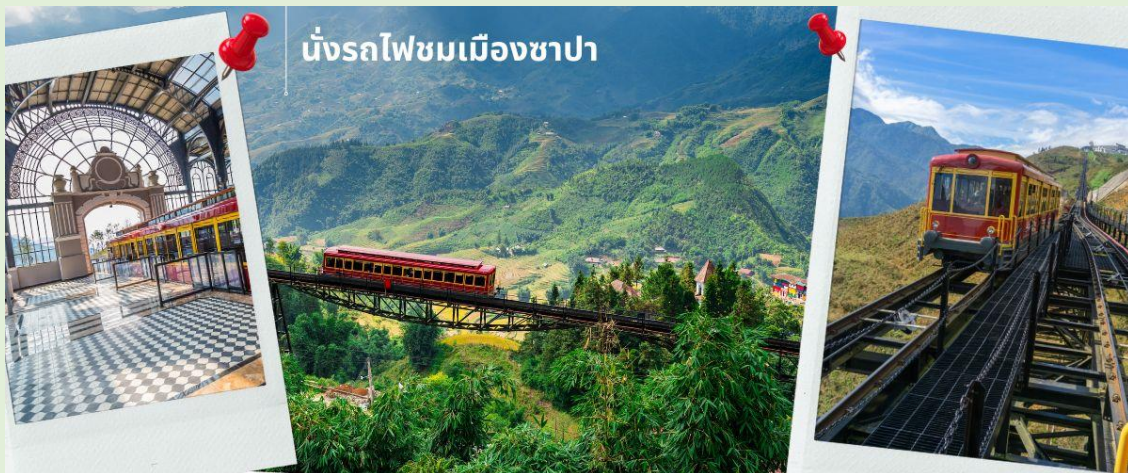
นั่งรถไฟชมเมืองซาปา

นำท่าน นั่งรถไฟชมเมืองซาปา (รวมค่ารถไฟชมเมือง) ท่านจะได้พบกับวิวทิวทัศน์ของเมืองซาปาที่เต็มไปด้วยความสดชื่น และสดกกลิ่นอายธรรมชาติ และยังคงตื่นตาไปด้วยวิวภูเขา และนาขั้นบันได ที่มีชื่อเสียงของเมืองซาปาอีกด้วย ความยาวประมาณ 2 กิโลเมตร โดยใช้เวลาประมาณ 20 นาทีเพื่อไปสู่สถานีขึ้นกระเช้าที่จะนำท่านขึ้นสู่ยอดเขาฟานซีปัน