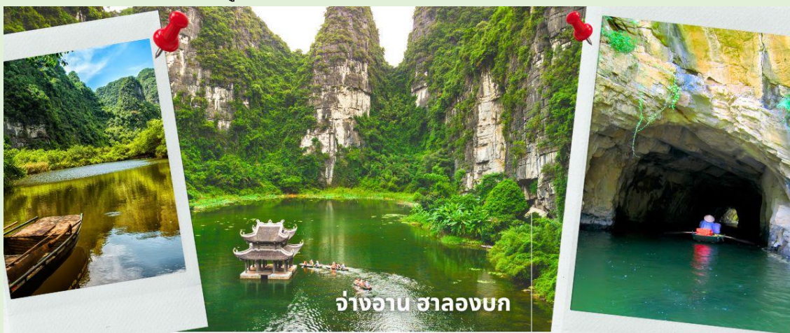
จ่างอาน ฮาลองบก

จากนั้นนำท่านเดินทางสู่ จ่างอาน เป็นพื้นที่ที่มีทั้งภูมิทัศน์อันงดงามของยอดเขาหินปูน แม่น้ำหลายสายไหลลัดเลาะ บางส่วนจมอยู่ใต้น้ำ และยังถูกล้อมรอบด้วยผาสูงชัน จึงทำให้สถานที่แห่งนี้น่าชม การชื่นชมทัศนียภาพที่สวยงามในจ่างอานนั้น คือการล่องเรือเล็กประมาณลำละ 4-5 คนเพื่อเข้าไปเยี่ยมชมจ่างอาน เรือแจวกี่จะพาเราไปเยี่ยมชมวัด หลังจากนั้นก็จะพาเราไปลอดถ้ำ มีทั้งหมด 49 ถ้ำ ซึ่งแต่ละถ้ำจะมีชื่อแตกต่างกันไปจะใช้เวลาล่องเรือไปกลับร่วมสองชั่วโมงเลย ที่เดียว จ่างอานยังถูกเรียกว่า ฮาลองบก เพราะที่นี่มีเขาหินปูนและถ้ำคล้ายกับที่อ่าวฮาลอง