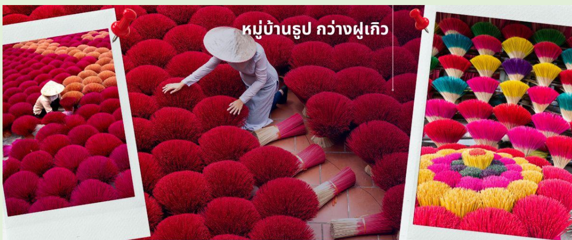
หมู่บ้านรูป กว้างฝูเกิว

จากนั้นนำท่านเดินทางสู่เมืองนิงห์บิ่งกั๊ว แวะเที่ยวชมวิถีของชาวเวียดนามใน หมู่บ้านรูป หมู่บ้านชุมชนที่เป็นแหล่งผลิตรูปที่ใหญ่ที่สุดแห่งหนึ่งของประเทศเวียดนาม หมู่บ้านกว้างฝูเกิว หมู่บ้านรูป เอกลักษณ์เหมือนทุ่งดอกไม้ใกล้กรุงซานฮอย ชาวบ้านที่ส่งต่อ และถ่ายทอดวิธีการทำรูปแบบดั้งเดิม ทั้งการเหลาไม้ฝอยมสี ตากแดด และมัดลักษณะคล้ายพุ่มไม้ หรือ ดอกไม้ เอกลักษณ์นี้ถูกพัฒนาและต่อยอด จัดแต่งรูปให้