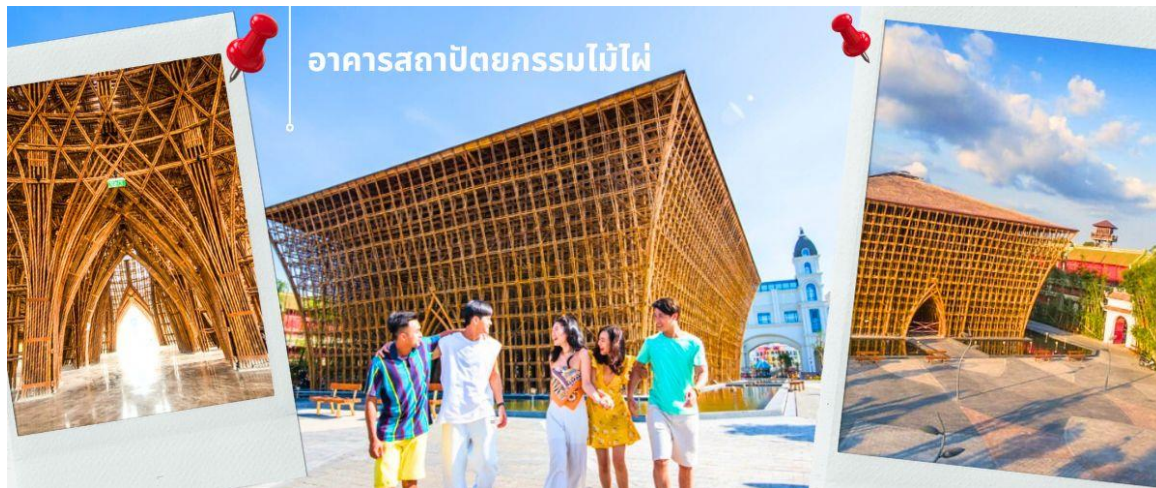
อาคารสถาปัตยกรรมไม้ไผ่

CVZP1 เกาะภูเก็ต-สวนสนุก Vin Wonders-อควาเรียมรูปเต่า-นั่งกระเช้า 3 วัน 2 คืน บิน VZ (Nov24-Mar25)