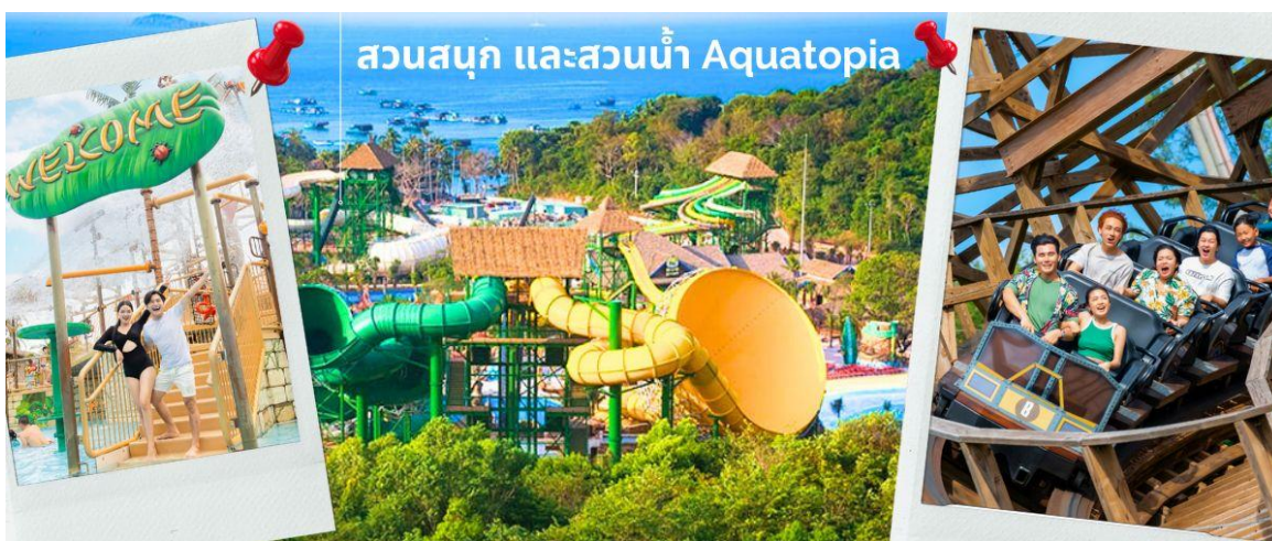
สวนสนุก และสวนน้ำ Aquatopia

จากนั้นนำท่าน ชมสวนน้ำ และสวนสนุก Aquatopia Park ที่ตั้งอยู่บนเกาะฮอนเทิม (Hon Thom) ประกอบด้วยสวนน้ำขนาดใหญ่ และเครื่องเล่นมากมายให้ท่านได้เลือกเล่นได้ตามใจชอบ สวนน้ำ Aquatopia ตั้งอยู่ทางตอนใต้ของเกาะฟูโก๊วก ถือเป็นสวนน้ำที่ใหญ่ที่สุดในเอเชียตะวันออกเฉียงใต้ที่มีเครื่องเล่นที่ทันสมัยมากกว่า 20 ชนิด นอกจากโซนสวนน้ำที่เหมาะสมสำหรับครอบครัวแล้ว Aquatopia Park ยังมีเครื่องเล่นที่น่าตื่นเต้นอีกมากมายให้ท่านได้เลือกเพลิดเพลิน รวมไปถึงร้านค้าจำหน่ายของฝาก และร้านอาหารมากมายให้เลือกรับประทาน ระหว่างเดินเที่ยวในสวนสนุกแห่งนี้