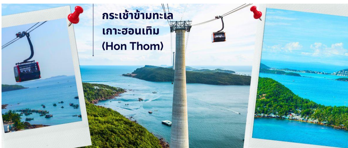
กระเช้าข้ามทะเล เกาะฮอนเทิม (Hon Thom)

นำท่านนั่ง กระเช้าข้ามทะเล Hon Thom Cable Car บรรยากาศสุดตื่นเต้นประทับใจ กับความสูงของกระเช้า และยิ่งทอดยาว ข้ามทะเลมุ่งสู่เกาะ ฮอนเทิม (Hon Thom) เกาะที่ได้ชื่อว่าเป็นเกาะแห่งการพักผ่อนอย่างแท้จริง โดยกระเช้าแห่งนี้ได้รับการขนานนามว่า เป็นกระเช้าข้ามทะเลที่ยาวที่สุดในโลกอันดับสาม โดยมีระยะทางยาว 7,899.9 เมตร อยู่ทางฝั่งทะเลใต้ของหมู่เกาะฟูโก๊วก ตัวกระเช้าขนาดใหญ่ สามารถรองรับผู้โดยสารได้มากถึง 30 คน เคลื่อนตัวด้วยความเร็วสูงสุด 8.5 เมตร/วินาที โดยใช้เวลาประมาณ 15 นาที