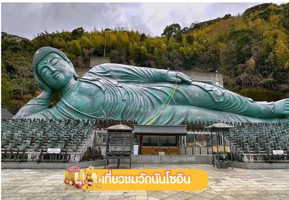
เที่ยวชมวัดนันโซอิน

... จนได้เวลาอันควร เดินทางต่อไปยัง วัดนันโซอิน (Nanzoin Temple) หรือที่เรียกว่า “วัดพระนอน” (รวมค่าเข้าชม) เป็นวัดพุทธที่ตั้งอยู่ในเมืองซาซากุริ เป็น พระพุทธรูปนอนทองสำริดที่ใหญ่ที่สุดในโลก โดยมีขนาดความยาว 41 เมตร สูง 11 เมตรหนัก 300 ตัน แกะสลักจากทองสัมฤทธิ์ชิ้นเดียว แล้วหล่อโดยใช้แบบหล่อไล่ซี่ผึ้ง โดยหลายคนเชื่อว่ารูปปั้นนี้สร้างขึ้นเพื่อปกป้องชาวฟูกูโอกะจากภัยธรรมชาติ บรรยากาศที่เงียบสงบ ชื่นช้อ เรื่องการขอพรโชคกลาง ควรเตรียมเหรียญ 5 เยน ในการทำบุญโยนเหรียญ **หมายเหตุ เป็นวัดที่เคร่งครัดในเรื่องการแต่งกาย ห้ามใส่กางเกง/กระโปรงสั้น เสื้อผ้าที่เปิดเผยร่างกาย ห้ามส่งเสียงดัง และใช้ไม้เซลฟี่ ... จากนั้นเดินทางเข้าสู่ ฟูกูโอกะ