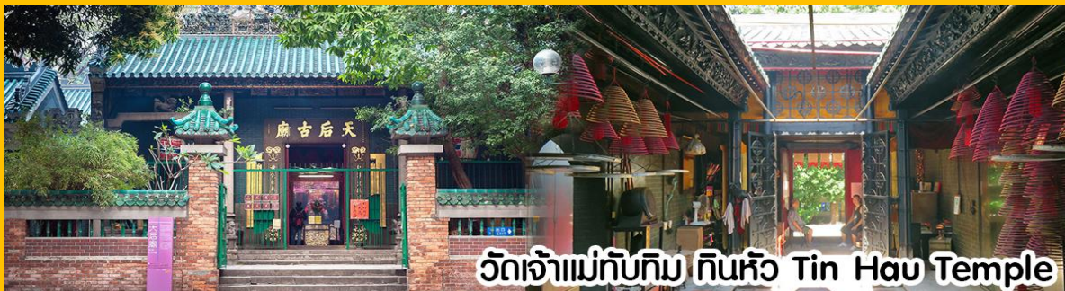
วัดเจ้าแม่ทับทิม ทินหัว Tin Hau Temple

** ชำระค่าทัวร์ในนามบริษัท ไลออน ทราเวล จำกัด เท่านั้น **