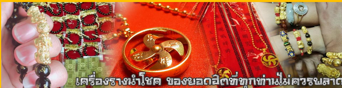
เครื่องรางนำโชค ของมงคลสัตว์ทุกท่านไม่ควรมลลาต

จากนั้นนำท่านสู่ ร้านหยก ชมความงามปีเซียะ ที่เชื่อกันว่าเป็นวัตถุมงคลยอดเยี่ยม ที่มีการนำมาบูชา เพื่อให้ช่วยป้องกันสิ่งชั่วร้าย เรียกทรัพย์เงินทองให้ไหลมาเทมา และกักเก็บทรัพย์นั้นไม่ให้รั่วไหลออกไปไหนได้ ชาวจีนโบราณเชื่อกันว่า ปีเซียะเป็นสัตว์ประหลาดที่รวมลักษณะของสัตว์มงคลทั้ง 5 ชนิดไว้ด้วยกัน ได้แก่ มังกร พญาราชสีห์หรือสิงโต, อินทรี, กวาง, และแมว โดยตามตำนานเล่าว่า ปีเซียะเป็นลูกมังกรตัวที่ 9 (เทพแห่งโชคลาภ) ของพญามังกรสวรรค์ มีชื่อเรียกด้วยกันหลายชื่อไม่ว่าจะเป็น “เทียนลก (กวางสวรรค์)” เป็นชื่อเดิม ส่วนจีนกวางตุ้งจะเรียกว่า “เผ่เข้า” และคนจีนแต้จิ๋วจะเรียกว่า “ผีซิว”และ ยังมีจำหน่ายยาสมุนไพรบำรุงเพิ่มความแข็งแรงตามความเชื่อของคนฮ่องกง