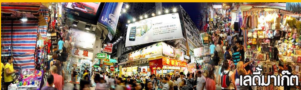
เลดี้มาร์เก็ต

จากนั้นอิสระให้ท่านช้อปปิ้ง ตลาดเลดี้ มาร์เก็ต (Ladies Market) เป็นตลาดบนถนนคนเดินสไตล์ Night Market แบบบ้านเรา ไม่ได้มีขายเฉพาะแต่ของผู้หญิงแต่มีของชายทุกสิ่งอย่าง เหมือนพวกตลาด Night ของบ้านเรา โดยจะปิดถนน Tong Choi Street ตั้งแต่แยกที่ตัดกับถนน Argyle Street ยาวตลอดถนน Tong Choi Street ไปจนถึงถนน Dundas Street ยาวประมาณ 500 เมตร สินค้าที่ขายกันจะมีอยู่หลากหลายแบบเช่นพวกตุ๊กตาตุ่นต่าง ๆ จากดิสนีย์, Marvel และจากญี่ปุ่น ประเภทสินค้า เสื้อผ้า นาฬิกากระเป๋า ตุ๊กตา ของฝาก ของที่ระลึก ต่าง ๆ ใครต้องการจะซื้อของที่ระลึกหรือของฝากต่าง ๆ ของฮ่องกงก็สามารถมาเดินเลือกซื้อกันได้ที่นี่