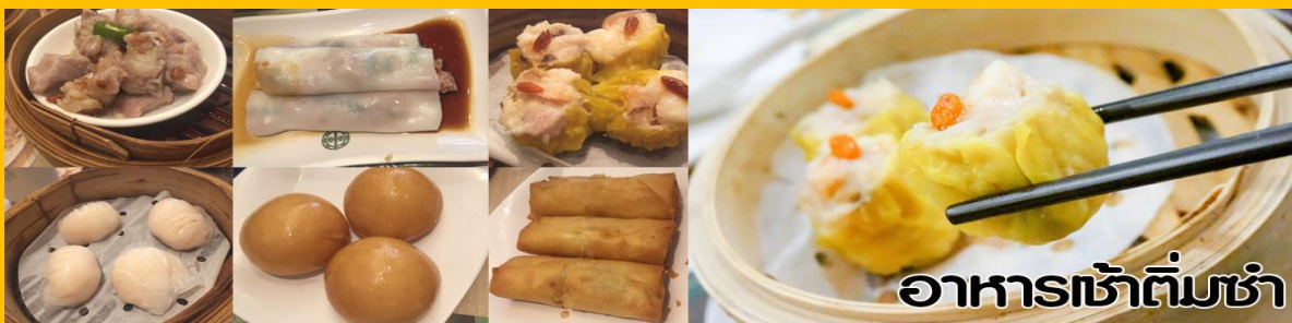
อาหารเช้าต้มยำ

วันที่สาม เจ้าแม่กวนอิมริฟลัสเบย์ - หวังต้าเซียน - เจ้าแม่ทับทิม - สนามบินฮ่องกง - กรุงเทพฯ เช้า รับประทานอาหารเช้า (ต้มยำ)