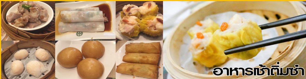
อาหารเช้าติ่มซำ

นำท่านไปไหว้ เจ้าแม่กวนอิมสงฮำ (Kun Im Temple Hung Hom) เป็นวัดเจ้าแม่กวนอิมที่มีชื่อเสียงแห่งหนึ่งในฮ่องกง ขอพรเจ้าแม่กวนอิมพระโพธิสัตว์แห่งความเมตตา ช่วยคุ้มครองและปกป้องรักษาวัดเจ้าแม่กวนอิมที่ Hung Hom หรือ "Hung Hom Kwun Yum Temple" เป็นวัดเก่าแก่ของฮ่องกงสร้างตั้งแต่ปี ค.ศ. 1873 ถึงแม้จะเป็นวัดขนาดเล็กที่ไม่ได้สวยงามมากมาย แต่เป็นวัดเจ้าแม่กวนอิมที่ชาวฮ่องกงนับถือมาก แทบทุกวันจะมีคนมาบูชาขอพรกันแน่นวัด ถ้าใครที่ชอบเสี่ยงเซียมซีเขาบอกว่าที่นี่แม่นมากที่สุดที่พิเศษกว่านั้น นอกจากสักการะขอพรแล้วยังมีพิธีขอของอั้งเปาจากเจ้าแม่กวนอิมอีกด้วย ซึ่งคนส่วนใหญ่จะนิยมไปไต่เตศกาลตรุษจีนเพราะเป็นสิริมงคลในเทศกาลปีใหม่ ซึ่งทางวัดจะจำหน่ายอุปกรณ์สำหรับเซ่นไหว้พร้อมซองแดงไว้ให้ผู้มาขอพร เมื่อสักการะขอพรโชคลากแล้วก็นำซองแดงมาวนเหนือกระถางธูปหน้าองค์เจ้าแม่กวนอิมตามเข็มนาฬิกา 3 รอบ และเก็บซองแดงนั้นไว้ซึ่งภายในซองจะมีจำนวนเงินที่ทางวัดจะเขียนไว้เล็กน้อยแล้วแต่โชค ถ้าหากเราประสบความสำเร็จเมื่อมีโอกาสไปฮ่องกงอีกก็ค่อยกลับไปทำบุญ ช่วงเทศกาลตรุษจีนจะมีชาวฮ่องกงและนักท่องเที่ยวไปสักการะขอพรกันมากขนาดต้องต่อแถวยาวมาก คนที่ไม่มีเวลาก็สามารถใช้เวลาอื่น ๆ ตลอดทั้งปีเพื่อขอซองแดงจากเจ้าแม่กวนอิมได้เช่นกัน โดยซื้ออุปกรณ์เซ่นไหว้จากทางวัดเพียงแต่เตรียมซองแดงไปเอง (ในกรณีที่ทางวัดไม่ได้เตรียมซองแดงไว้ให้เนื่องจากไม่ได้ไต่เตศ)