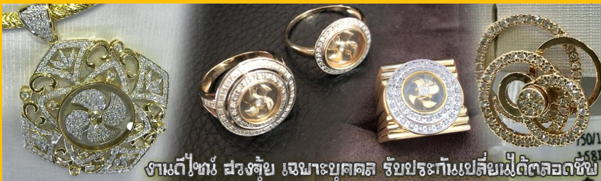
งานดีไซน์ ฮวงจุ้ย เฉพาะบุคคล รับประกันประสิทธิภาพดีตลอดชีพ

นำท่านเยี่ยมชม โรงงานจิวเวลรี่ ที่ขึ้นชื่อของฮ่องกงพบกับงานดีไซน์ที่ได้รับรางวัลอันดับยอดเยี่ยม และใช้ในการเสริมดวง เรื่อง ฮวงจุ้ยนำความโชคดี มั่งคั่งแก่ผู้สวมใส่ ซึ่งในเมืองไทยก็ได้นิยมแพร่หลายออกไป ไม่ว่าจะเป็นกลุ่ม ดารา นักการเมือง พ่อค้าแม่ขายที่ประกอบธุรกิจ เจ้าของกิจการห้างร้านต่าง ๆ ซึ่งเชื่อกันว่าจะนำสิ่งดี ๆ ปัดเป่าสิ่งชั่วร้ายให้กับบุคคลที่สวมใส่ ซึ่งจะมีมากมายหลายชนิด เช่น จี้กั๊กหัน แหวนรุ่นต่าง ๆ นาฬิกาข้อมือ (ซึ่งผู้สวมใส่จะได้รับการดูลายมือจากซินแซประจำร้าน เพื่อนำวิธีการเสริมดวงในการสวมใส่โดยไม่ติดต่อบริการ)