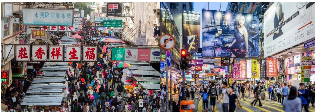
ค้า อิสระอาหารค้าเพื่อความสะดวกในการท่องเที่ยว

จากนั้นให้ท่านอิสระช้อปปิ้ง เลดี้มาร์เก็ต (Lady Market) อยู่ในย่านมงก๊ก เป็นถนนสายช้อปปิ้ง ถนนแต่ละสายจะมีพ่อค้าแม่ค้าที่ขายสินค้าเพียงประเภทเดียวเท่านั้น ทำให้สะดวกต่อการเลือกซื้อมากขึ้น ขายของหลากหลายตั้งแต่ เสื้อผ้าแฟชั่น เครื่องประดับ เครื่องสำอางค์ รองเท้าผ้าใบ เครื่องใช้ในครัว อุปกรณ์อิเล็กทรอนิกส์ เป็นต้น ที่นี้คุณสามารถซื้อและต่อรองราคาของได้เกือบทุกอย่าง