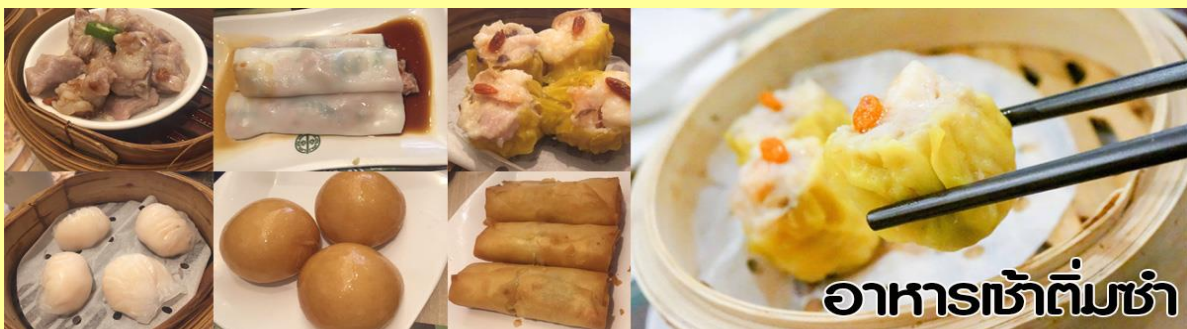
อาหารเช้าต้มซำ