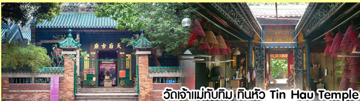
วัดเจ้าแม่ทับทิม ทินหัว Tin Hau Temple

นำทุกท่าน ไหว้ศาลเจ้าแม่ทับทิม ทินหัว (Tin Hau Temple) เป็นวัดเก่าแก่และสำคัญอีกวัดหนึ่งของฮ่องกง เพราะในสมัยก่อนฮ่องกงเป็นเพียงหมู่บ้านชาวประมง ซึ่งเคารพนับถือเจ้าแม่ทับทิมว่าเป็นเทพีแห่งทะเล เพื่อให้เดินทางปลอดภัย เวลาออกไปทำงานไกล ๆ หรือออกหาปลา นอกจากการมาสักการะบูชาเจ้าแม่ทับทิมในเรื่องของการเดินทางให้ปลอดภัยแล้ว ไฮไลท์สำคัญอีกอย่างหนึ่งของ วัดเจ้าแม่ทับทิม ทินหัว (Tin Hau Temple) จะเป็นขดรูปสี่แดงขนาดใหญ่ ที่แขวนอยู่ตามเพดานด้านในวิหารของวัดเต็มไปหมด จะยิ่งสวยงามในยามที่มีแสงแดงส่องลงมาเหมือนเป็นลำแสงส่องทะลุวันรูปแปลกตายิ่งนัก ส่วนอาคารของวัดก็จะเป็นสถาปัตยกรรมแบบวัดจีน สร้างขึ้นตั้งแต่ปีค.ศ. 1876 โดยทางเข้าของวัดจะอยู่ติดกับสวนสาธารณะเล็กๆ ที่มีต้นไม้ใหญ่หลายต้น ให้บรรยากาศร่มรื่น