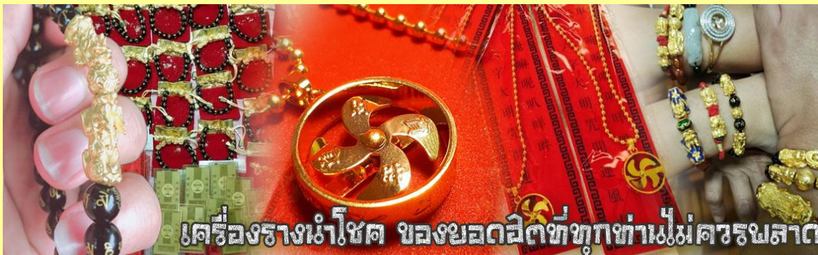
เครื่องรางนำโชค ของยอดสิทธิ์ทุกท่านไม่ควรมองลาด

จากนั้นนำท่านสู่ ร้านหยก ชมความงามปีเซี่ยะ ที่เชื่อกันว่าเป็นวัตถุมงคลยอดเยี่ยม ที่มีการนำมาบูชา เพื่อให้ช่วยป้องกันสิ่งชั่วร้าย เรียกรทรัพย์เงินทองให้ไหลมาเทมา และกักเก็บทรัพย์นั้นไม่ให้รั่วไหลออกไปไหนได้ ชาวจีนโบราณเชื่อกันว่า ปีเซี่ยะเป็นสัตว์ประหลาดที่รวมลักษณะของสัตว์มงคลทั้ง 5 ชนิดไว้ด้วยกัน ได้แก่ มังกร พญาราชสีห์หรือสิงโต, อินทรี, กวาง, และแมว โดยตามตำนานเล่าว่า ปีเซี่ยะเป็นลูกมังกรตัวที่ 9 (เทพแห่งโชคลาภ) ของพญามังกรสวรรค์ มีชื่อเรียกตัวด้วยกันหลายชื่อไม่ว่าจะเป็น “เทียนลก (กวางสวรรค์)” เป็นชื่อเดิม ส่วนจีนกวางตุ้งจะเรียกว่า “เผ่ฮ่า” และคนจีนแต้จิ๋วจะเรียกว่า “ผีซิว”