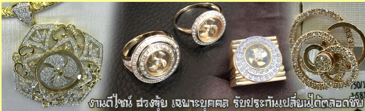
งานดีไซน์ สวยล้ำ เฉพาะบุคคล รับประกันเปลี่ยนไม่ตัดลดชิ้น

นำท่านเยี่ยมชม โรงงานจิวเวลรี่ ที่ขึ้นชื่อของฮ่องกงพบกับงานดีไซน์ที่ได้รับรางวัลอันดับยอดเยี่ยม และใช้ในการเสริมดวงเรื่อง ฮวงจุ้ยนำความโชคดี มั่งคั่งแก่ผู้สวมใส่ ซึ่งในเมืองไทยก็ได้นิยมแพร่หลายออกไป ไม่ว่าจะเป็นกลุ่ม ดารา นักการเมือง พ่อค้าแม่ขายที่ประกอบธุรกิจ เจ้าของกิจการห้างร้านต่าง ๆ ซึ่งเชื่อกันว่าจะนำสิ่งดี ๆ ปัดเป่าสิ่งชั่วร้ายให้กับบุคคลที่สวมใส่ ซึ่งจะมีมากมายหลายชนิด เช่น จี้กั๊กหัน แหวนรุ่นต่าง ๆ นาฬิกาข้อมือ (ซึ่งผู้สวมใส่จะได้รับการดูลายมือจากซินเซประจําร้าน เพื่อนำวิธีการเสริมดวงในการสวมใส่โดยไม่ติดค่าบริการ)