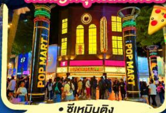
• ซีเหมินตง