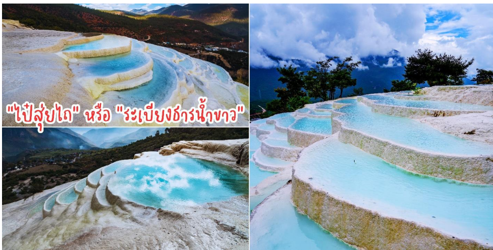
"ไป๋ส่วยไต" หรือ "ระเบียงธารน้ำขาว"

นำท่าน สู่เมืองลี่เจียง ระหว่างทางชม ชวนชมธรรมชาติอันงดงามของ "ไป๋ส่วยไต" หรือ "ระเบียงธารน้ำขาว" ซึ่งตั้งอยู่บนความสูงเหนือระดับน้ำทะเล 2,380 เมตร และครอบคลุมพื้นที่ประมาณ 3 ตารางกิโลเมตร ในตำบลชานป่า เมืองเซียงเก้อหลี่ลาหรือแซงกรีลา มณฑลยูนนาน (ยูนนาน) ทางตะวันตกเฉียงใต้ของจีนระเบียงธารน้ำขาวแห่งนี้ก่อตัวขึ้นจากการตกสะสมตัวของแคลเซียมคาร์บอเนตในน้ำที่ไหลจากน้ำพุ สร้างเป็นทิวทัศน์ความมหัศจรรย์ทางธรรมชาติจวบจนปัจจุบัน ทั้งยังได้รับสมญานามว่า "สถานที่ที่เมฆขาวทิ้งร่องรอยบนโลกา"