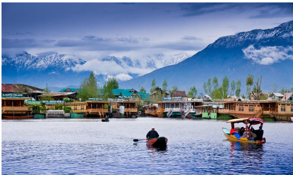
ล้อมโดยรอบ ในสมัยที่ถูกปกครองโดยราชวงศ์โมกุล มีการจัดทำผังเมืองขึ้นมาใหม่ จึงทำให้แคชเมียร์เป็น

DAY 2 สนามบินเดลี – สนามบินศรีนาคา – แคชเมียร์ – กุลมาร์ค – นั่งกระเช้าลอยฟ้า – ชมทิวทัศน์เทือกเขากุลมาร์ค – ศรีนาคา – ล่องเรือชิคาร่า – ทะเลสาบดาล (B/L/D) เช้า บริการอาหาร ณ ห้องอาหารของโรงแรม 07.40 ออกเดินทางสู่ ท่าอากาศยานศรีนาคา เมืองแคชเมียร์ ประเทศอินเดีย โดยสายการบิน INDIGO เที่ยวบินที่ 6E 5201 09.10 เดินทางถึง ท่าอากาศยานศรีนาคา รัฐแคชเมียร์ ประเทศอินเดีย หลังผ่านขั้นตอนการตรวจหนังสือเดินทาง และตรวจรับสัมภาระเรียบร้อยแล้ว นำท่านสู่ตัว เมืองศรีนาคา (SRINAGAR) ซึ่งเป็นเมืองหลวงของแคชเมียร์ ประกอบด้วยทะเลสาบขนาดใหญ่ คือ ทะเลสาบดาล และ ทะเลสาบนากัน ด้านหลังมีเทือกเขาโอบล้อมโดยรอบ ในสมัยที่ถูกปกครองโดยราชวงศ์โมกุล มีการจัดทำผังเมืองขึ้นมาใหม่ จึงทำให้แคชเมียร์เป็น