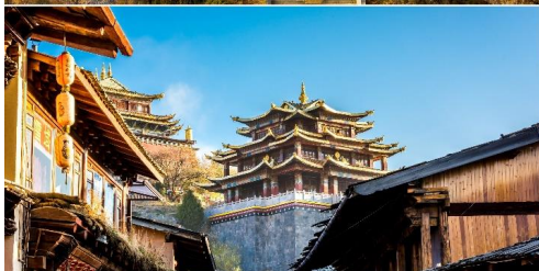
เมืองโบราณแชงกรีล่า