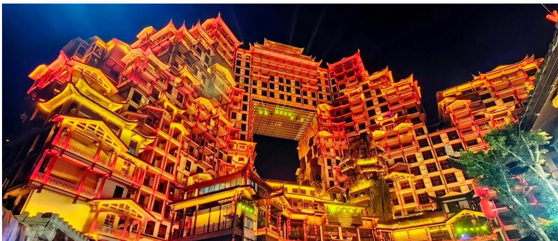
ที่พัก REZEN S HEYI HOTEL หรือเทียบเท่าระดับ 5 ดาว (มาตรฐานประเทศจีน)

นำท่านชม ตึกมหัศจรรย์72ชั้น อาคารที่สร้างจำลองถ้ำประตูสวรรค์ และบ้านของชาวถู่เจียชนเผ่าพื้นเมืองของจางเจียเจีย จุดท่องเที่ยวแห่งใหม่ของจางเจียเจีย แหล่งรวมร้านอาหาร ผับบาร์ ร้านขายของที่ระลึก รีสอร์ทและโฮมสเตย์ ที่แบ่งออกเป็นหลายๆ ส่วนอันรวมเอาเอกลักษณ์ของจีนมาไว้ที่นี้ทั้งสิ้น ไม่ว่าจะบนสีสันเลียนแบบยุคเจ้าพ่อเซี่ยงไฮ้ ย่านโรงเตี๊ยมโบราณ งานแสดงโคมไฟสีสันอันเป็นเอกลักษณ์ นอกจากนี้ยังมีการแสดงจากเหล่านักร้องนักแสดงอยู่อีกมากมาย