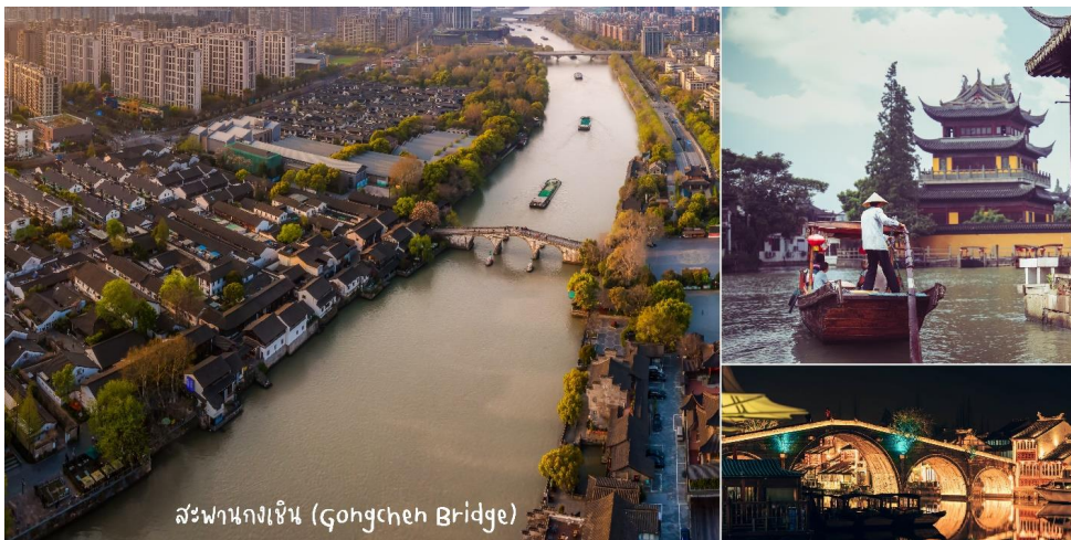
สะพานกงเฉิน (Gongchen Bridge)

นำท่านสู่ ชมวิวคลองจิงอันตา และสะพานกงเฉิน (Gongchen Bridge) ซึ่งเป็นหนึ่งในสถานที่ที่ดีที่สุดในการชมทางน้ำที่มีชื่อเสียงระดับโลกอย่างแน่นอน มักได้รับการยกย่องว่าเป็นทางน้ำที่เก่าแก่และยาวที่สุดในโลก โดยเริ่มต้นจากปากกังทางตอนเหนือและสิ้นสุดที่ทางโจวทางตอนใต้ ไปเยี่ยมชมอาคารเก่าแก่ริมคลองและล่องเรือในคลองเพื่อชมและสัมผัสวัฒนธรรมจีนและชีวิตที่แท้จริง (ราคาทัวร์ไม่ค้ำล่องเรือ)