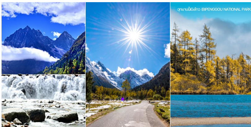
อุทยานบีเฟิงโกว (BIFENGGOU NATIONAL PARK)

URGENT! เส้นทางเดินทางสู่พื้นที่ราบสูงมากกว่า 2500 เมตรจากระดับน้ำทะเล มีออกซิเจนบางเบา และมีความกดอากาศต่ำ การหายใจลำบาก และน้ำคอเคลือบผิวร่างกายแบบช้าๆ ใช้วิธีออกซิเจนขณะเดินทางที่ราบสูง **เตรียมหรืออานบนบ้านบน**