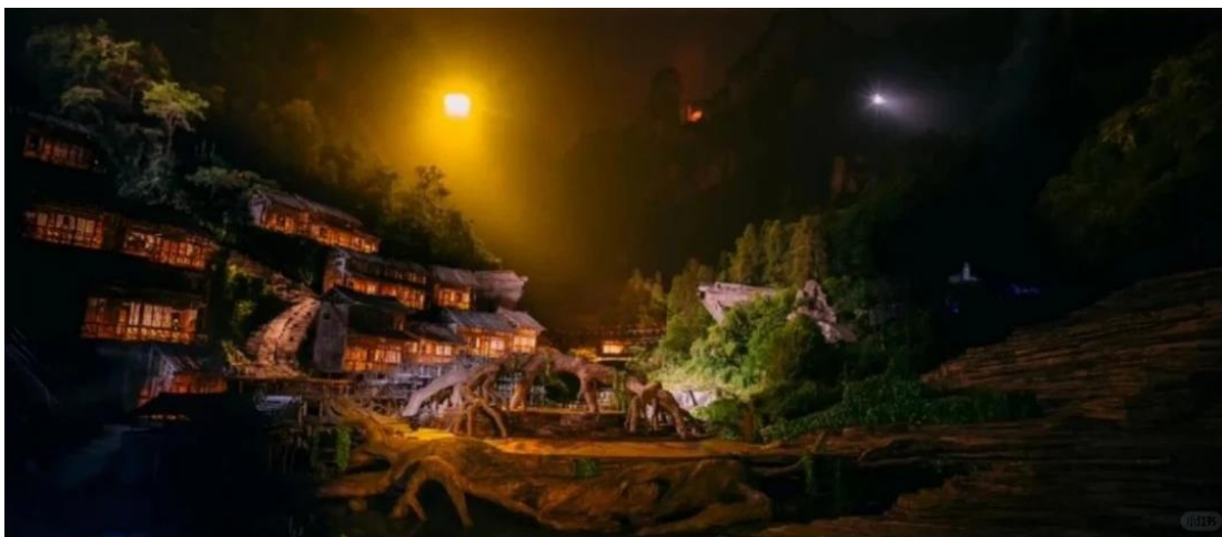
ที่พัก COUNTRY GARDEN PHOENIX HOTELหรือเทียบเท่าระดับ 5 ดาว (มาตรฐานประเทศจีน)

หมายเหตุ หากวันเดินทางดังกล่าวทางโหวงการการแสดง ทางบริษัทขอสงวนสิทธิ์เปลี่ยนเป็นโหวงเสน่ห์เซียงซีแทนหรือโหวงตำนานรักพันปี โดยไม่ต้องแจ้งให้ทราบล่วงหน้าและไม่มีการคืนค่าใช้จ่ายใดๆทั้งสิ้น