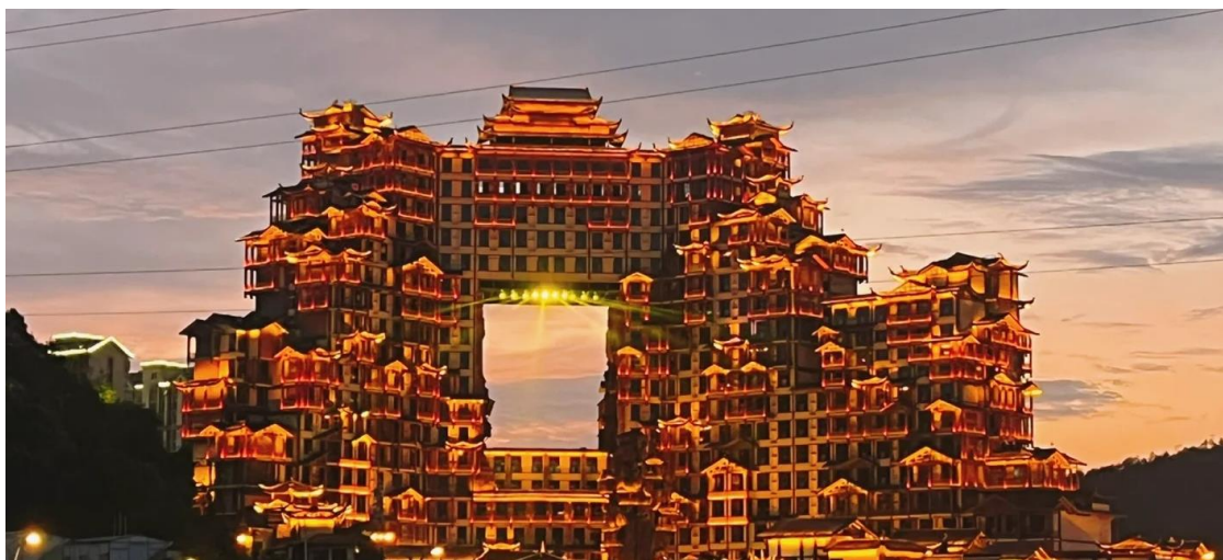
ที่พัก COUNTRY GARDEN PHOENIX HOTEL หรือเทียบเท่าระดับ 5 ดาว (มาตรฐานประเทศจีน)

นำท่านชม ติงมัทศจรรย์72ชั้น อาคารที่สร้างจำลองถ้ำประตูสวรรค์ และบ้านของชาวภูเจียงชนเผ่าพื้นเมืองของจางเจียเจีย จุดท่องเที่ยวแห่งใหม่ของจางเจียเจีย แหล่งรวมร้านอาหาร ผับบาร์ ร้านขายของที่ระลึก รีสอร์ทและโฮมสเตย์ ที่แบ่งออกเป็นหลายๆ ส่วนอันรวมเอาเอกลักษณ์ของจีนมาไว้ที่นี้ทั้งสิ้น ไม่ว่าจะป็นถนนสี่ล้อแบบยุคเจ้าพ่อเชียงไฮ้ ย่านโรงเตี๊ยมโบราณ งานแสดงโคมไฟสีสันอันเป็นเอกลักษณ์ นอกจากนี้ยังมีการแสดงจากเหล่านักร้องนักแสดงอยู่อีกมากมาย