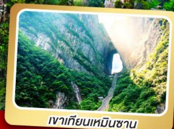
เวาเทียนเหมินชาน

ทริปเดียวเที่ยว 2 เมืองโบราณ ฝูหรงและเฟิ่งหวง ลิ้มรส สุกี้เด็ด ปิ้งย่างเกาหลี เปิดปิกนิก