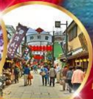
ย่านโบราณ ชิบูยะ

34,919 บาท ราคาเริ่มต้น รวมภาษีมูลค่าเพิ่ม 7%