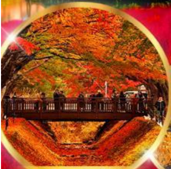
อุโมงค์เมเปิ้ล