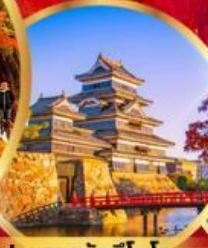
ปราสาทมัตสึโมโตะ