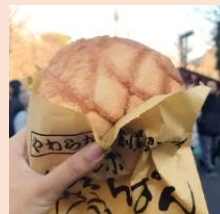
ซึ่งเหมือนผิวเมล่อนของญี่ปุ่น

และตกท้ายด้วยร้านขายขนมที่คนญี่ปุ่น มายังวัดแห่งนี้ต้องมาต่อคิวกันเพื่อลิ้มลองกั๊ปรสชาติสุดแสนอร่อย ขนาดองค์จักรพรรดิยังรับสั่งคนสนิทให้มาซื้อที่นี่!!! นั่นก็คือ “เมล่อนปัง” เป็นขนมปังแบบดั้งเดิมของญี่ปุ่น บางคนอาจจะเข้าใจผิดว่าเป็นขนมปังสอดไส้เมล่อน แต่จริงๆแล้วคือขนมปังอบแล้วด้านบนมีลายแตกๆ เป็นที่มาของชื่อ “เมล่อนปัง” นั่นเอง