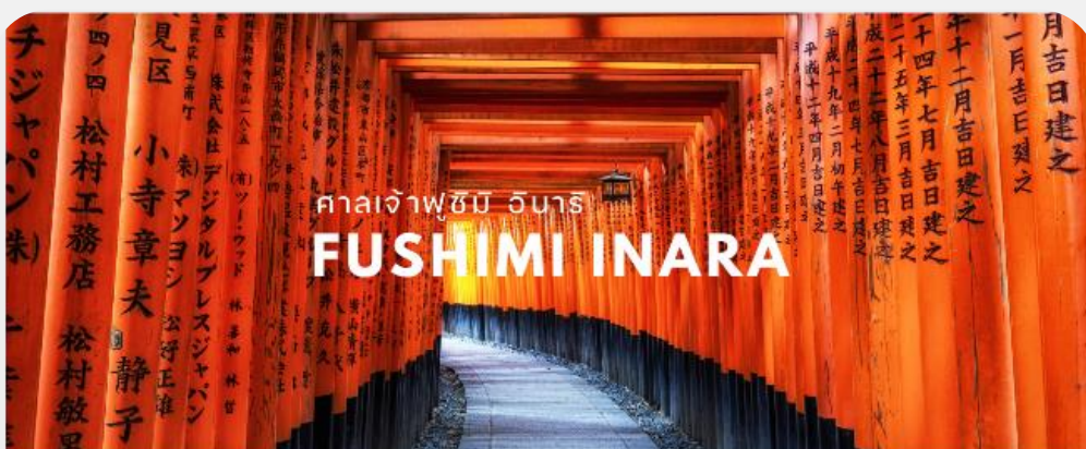
ศาลเจ้าฟูชิมิ อินาริ FUSHIMI INARA

ร้านขายสินค้าต่างๆ และร้านขนมพื้นเมือง พุดได้เลยว่ามิให้เลือกเออะแยะเติมไปหมด สิ่งที่ทำให้ยานนี้มีเสน่ห์มากที่สุดก็จะเป็นรูปแบบอาคารบ้านเรือนร้านค้าที่ยังคงความเก่าแก่เป็นสไตล์โบราณ อิสระให้ท่านได้เดินเล่น เลือกซื้อ เลือกดูของตามอัธยาศัย