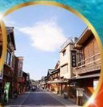
ถนนคนเดินอิเซะ