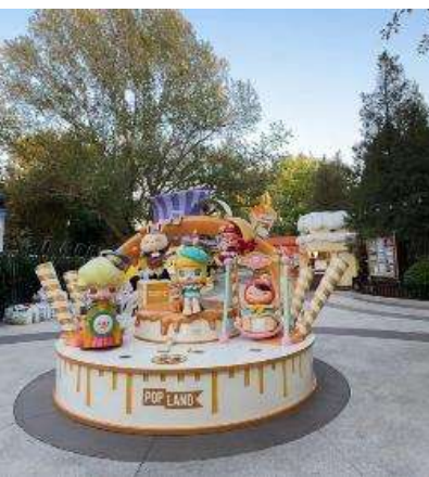
GO1PEK-CA006 ปักกิ่ง เที่ยวบิน 2 สวนสนุก UNIVERSAL STUDIO + POP LAND 5วัน 3คืน โดยสายการบิน Air China (CA)

** ชำระค่าทัวร์ในนามบริษัท ไลออน ทราเวล จำกัด เท่านั้น **