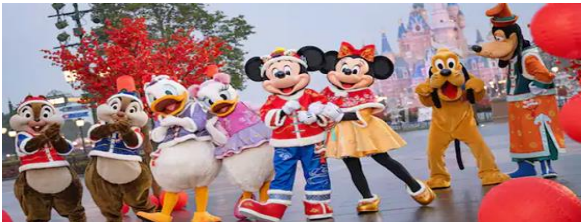
GO1PVG-FM002 เซียงไฮ้ ดิสนีย์แลนด์ ขึ้นชมวิวหอไข่มุก 5วัน 4คืน โดยสายการบิน Shanghai Airlines (FM)

สนุกกับเมืองเทพนิยาย เป็นโซนที่ตั้งของปราสาทดิสนีย์ ที่มีชื่อว่า “Enchanted Storybook Castle” ท่านจะได้พบกับโชว์อันยิ่งใหญ่ตระการตาและตัวการ์ตูนที่ท่านชื่นชอบ อาทิเช่น สโนว์ไวท์, เจ้าหญิง นิทรา, ซินเดอเรลล่า, มิกกี้เมาท์, หนีมัลลู และเพื่อนๆตัวการ์ตูนอันเป็นที่ใฝ่ฝันของทุกคน และยังมีโซน กิจกรรมอย่างเช่น “Once Upon a Time Adventure” เป็นการผจญภัยภายในปราสาทดิสนีย์ พบ เรื่องราวของสโนว์ไวท์ ผ่านจอภาพแบบสามมิติ หรือ “Alice in Wonderland Maze” เป็นทางเดินผ่าน เขาวงกตเพื่อเข้าไปเจอตัวละครจาก Alice in Wonderland และเครื่องเล่นไฮไลท์ของโซนนี้ก็คือ “Seven Dwarfs Mine Train” นั่งรถไฟเข้าเหมืองแร่ไปกับคนแคระทั้ง 7 ขวนให้สนุกและหวาดเสียว