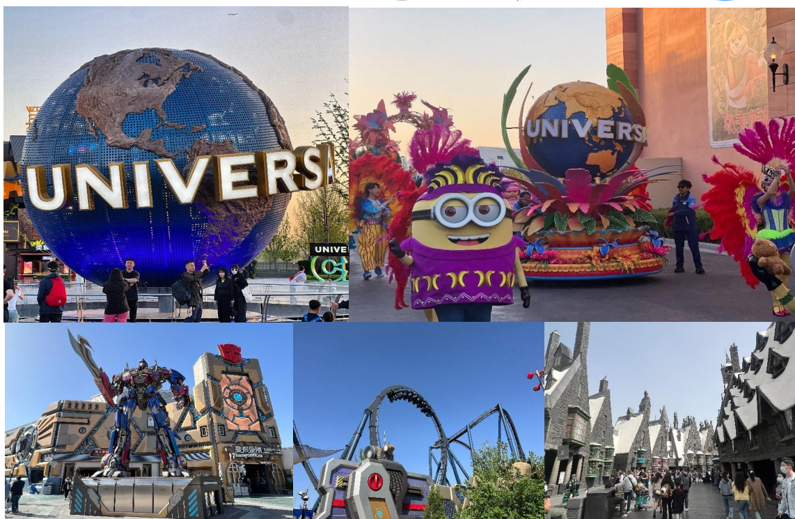
GO1CNXPEK-CA007 เชียงใหม่ เที่ยวบิน 2 สวนสนุก มหานครปักกิ่ง Universal Studio + Pop Land 5วัน 3 คืน 5 วัน 3 คืน (CA) ไม่ลงร้าน

** ชำระค่าทัวร์ในนามบริษัท ไลออน ทราเวล จำกัด เท่านั้น **