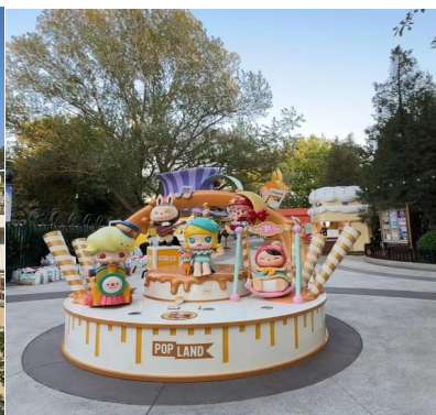
GO1CNXPEK-CA007 เชียงใหม่ เทียว 2 สวนสนุก มหานครปักกิ่ง Universal Studio + Pop Land 5วัน 3 คืน 5 วัน 3 คืน (CA) ไม่ลงร้าน