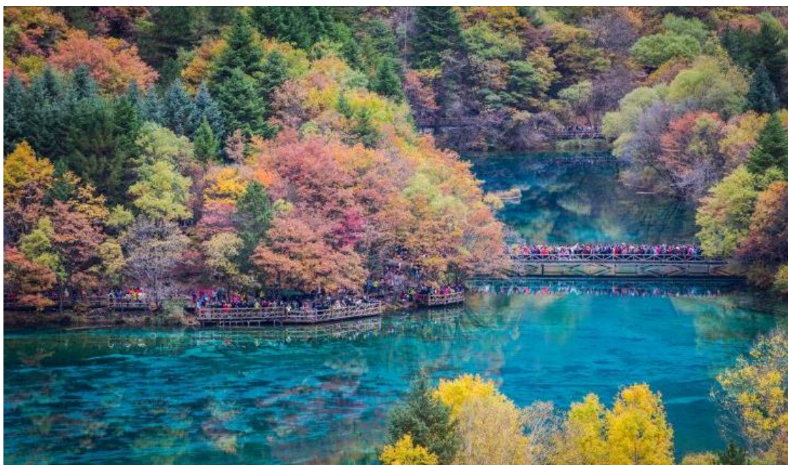
GO1TFU-TG009 เฉิงตู หวงหลง จิวจ้ายโกว ดูหมีแพนด้า 6วัน 5คืน โดยสายการบิน Thai Airway (TG)

หมายเหตุ กรณีต้องการนั่งรถเหมาอุทยาน สอบถามได้ที่หัวหน้าทัวร์