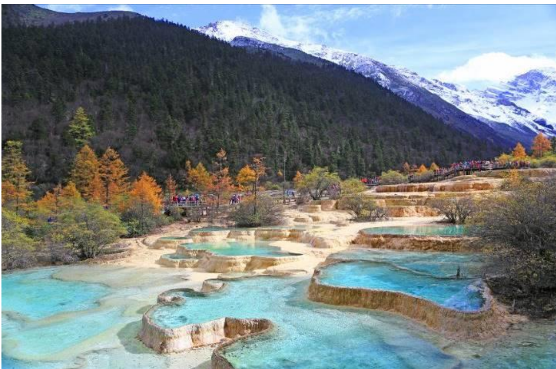
GO1TFU-TG009 เจิงตู หวงหลง จิวจ้ายโกว ดูหมีแพนด้า 6วัน 5คืน โดยสายการบิน Thai Airway (TG)

เช้า รับประทานอาหารเช้า ณ ห้องอาหารภายในโรงแรม (มื้อที่ 2)