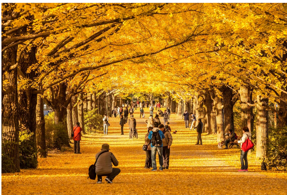
T2G-NRT17TG SPECIAL AUTUMN... TOKYO NIKKO FUJI GINKO FESTIVAL 6D4N (TG)

นำท่านสู่ ย่านซึกิจิ (Tsukiji) ตลาดปลาซึกิจิ (Tsukiji Fish Market) ตัวตลาดแบ่งเป็น 2 ส่วน คือ ตลาดในสำหรับค้าส่งพวกอาหารทะเล ผักและผลไม้ ซึ่งจะเปิดให้นักท่องเที่ยวเข้าชมหลัง 9:00 น. รวมถึงการประมูลปลาทูน่า ที่จะเปิดให้เข้าชมเป็น 2 รอบ คือ 5.25 น. และ 5.50 น. ส่วนตลาดนอกเป็นตลาดสำหรับร้านค้าปลีกนานาชนิดและร้านอาหาร โดยร้านค้าต่างๆ จะเปิดตั้งแต่ประมาณ 9:00 - 14:00 น. หากต้องการทานอาหารญี่ปุ่นอร่อยๆ แนะนำให้แวะมาที่ตลาดนอก โดยมีอาหารขึ้นชื่อ คือซูชิ ซาซิมิ และไขหวานย่าง