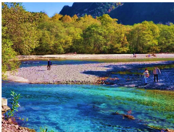
T2G-NRTHND01TG Wonderful Autumn ...Tokyo Fuji Kamikochi Kochia 7D 4N (TG)

** ชำระค่าทัวร์ในนามบริษัท ไลออน ทราเวล จำกัด เท่านั้น **