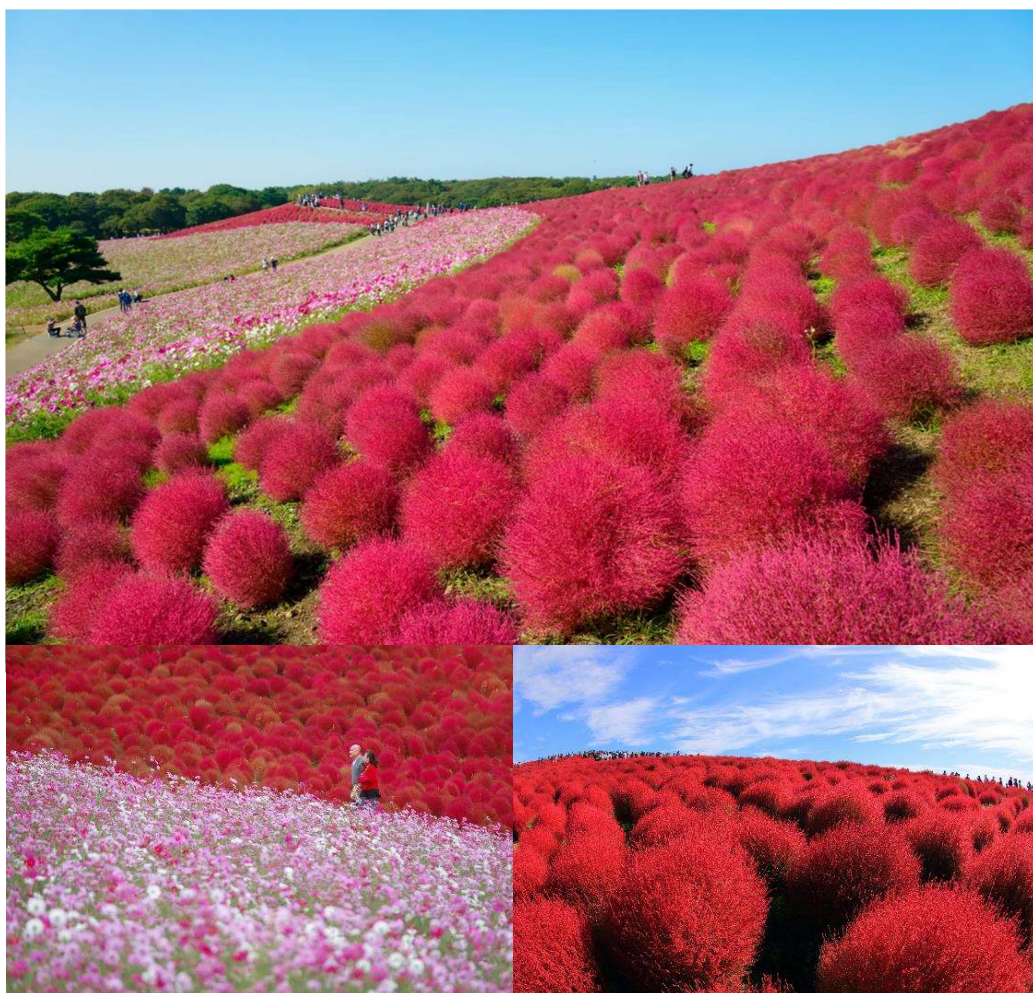
T2G-NRTHND01TG Wonderful Autumn ...Tokyo Fuji Kamikochi Kochia 7D 4N (TG)