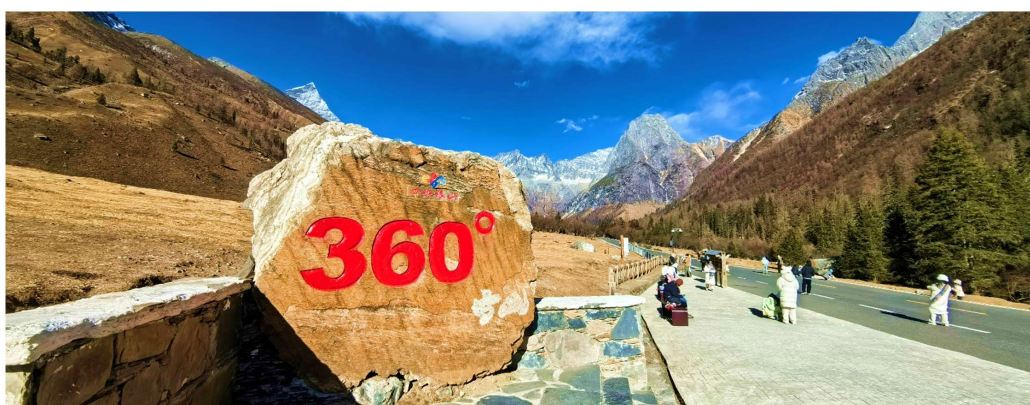
T2G-TFU06SL หนีหนาว เจียงตู... จิวจ้ายโกว หวงหลง ภูเขาซีดรุณี 6D 5N (SL) ไม่ลงบ้านรัฐบาล

ชมความงามระดับโลกของ ภูเขาซีดรุณี ภูเขาหินใหญ่โตที่มีลักษณะที่สูงชัน ด้านบนยอดเขาถูกปกคลุมไปด้วยหิมะขาวโพลนตลอดทั้งปี มองดูเหมือนหญิงสาวที่ปกคลุมหน้าด้วยผ้าขาว ตั้งตำนานของสี่สาวพี่น้อง คือ ต้าภูเหินยงซาน เออร์ภูเหินยงซาน ซานภูเหินยงซาน และชื่อภูเหินยงซาน บริเวณตีนเขานั้นจะถูกปกคลุมไปด้วยผืนป่าอันอุดมสมบูรณ์ มีธารน้ำใสที่ไหลผ่าน และมีสายลมเย็นพัดผ่านทุ่งหญ้าและผืนป่า จนทำให้ความสวยงามของภูเขาซีดรุณีมีความสวยงามเหมือนกับยุโรปตอนใต้ ทำให้ที่นี่ได้รับการขนานนามว่า "เทือกเขาแอลป์แห่งดินแดนตะวันออก" ซึ่งความสวยงามของภูเขาซีดรุณีจะเปลี่ยนแปลงไปตามฤดูกาล (รวมรถอุทยานแล้ว)