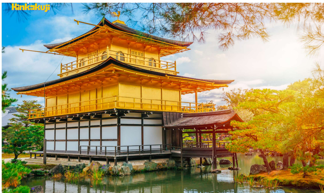
T2G-NRTKIX01TG Autumn Golden Route...Tokyo Fuji Kamikochi Shirakawago Osaka 7D 5N (TG)