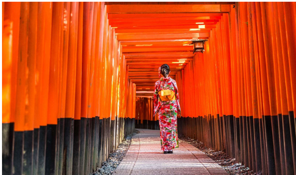
T2G-NRTKIX01TG Autumn Golden Route...Tokyo Fuji Kamikochi Shirakawago Osaka 7D 5N (TG)

เช้า รับประทานอาหารเช้า ณ ห้องอาหารโรงแรม