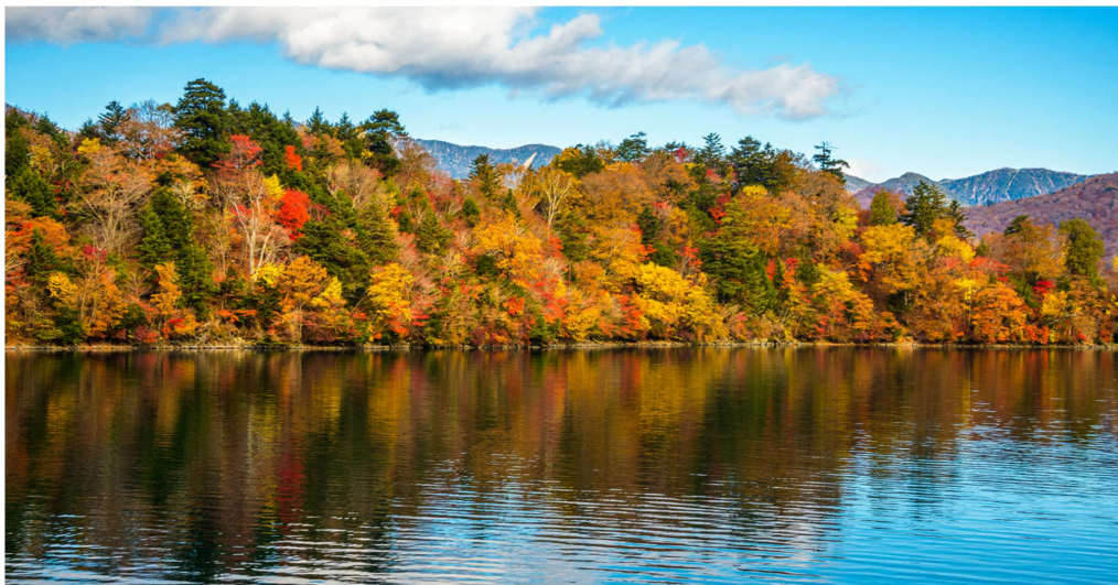
T2G-NRT16TG EXCLUSIVE AUTUMN... TOKYO NIKKO FUJI KOCHIA 6D4N (TG)

เช้า บริการอาหารเช้า ณ ห้องอาหารของโรงแรม