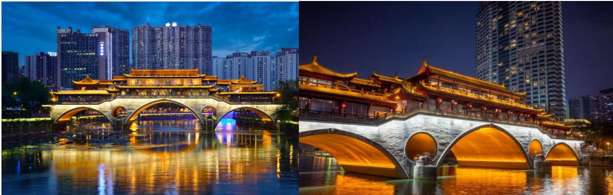
ได้เวลาอันสมควรเดินทางไปยัง ท่าอากาศยานเจ็ดเทียนฟู ประเทศจีน

นำท่านแวะถ่ายรูปจุดชมวิว สะพานอันซุน เป็นสะพานในเมืองหลวงของเจ็ดมณฑลเสฉวนประเทศจีนเป็นสะพานข้ามแม่น้ำจิน สะพานที่มีหลังคาปิดนั้นมีย่านอาหารที่ค่อนข้างใหญ่และเป็นร้านยอดนิยมที่สุดในเมือง