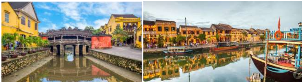
หน้า 4 (ภาพใช้เพื่อการโฆษณาเท่านั้น)