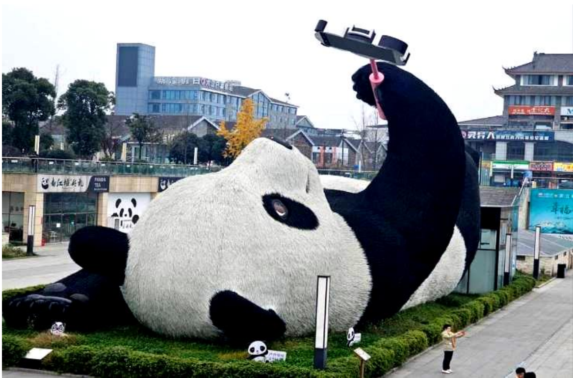
SBTTFU-SL003 เฉิงตู จิว่จ้ายโกว โทมวหนี่โกว ภูเขาสี่ตรุณี (นั่งรถไฟความเร็วสูง) 6วัน 5คืน โดยสายการบิน Lion Air (SL)

จากนั้นนำท่านถ่ายกับรูปปั้นผลงานศิลปะ รูปแพนด้าถ่ายเซลฟี่ ที่ตั้งอยู่กลางจัตุรัสสุดน่ารัก ซึ่งออกแบบโดยนักออกแบบชื่อดัง Florentijn Hofman หมีแพนด้าตัวนี้มีความยาว 26 เมตร กว้าง 11 เมตร สูง 12 เมตรและหนัก 130 ตัน อยู่ในท่านอนหงายอยู่บนพื้น เท้ายกขึ้นจับไม้เซลฟี่สีชมพู เล่นถ่ายเซลฟี่อย่างสบายอารมณ์ น่ารักน่าเอ็นดูมาก นักออกแบบ Hofman แนะนำว่าผลงานแพนด้ายักษ์โทรศัพท์มือถือขึ้นเพื่อถ่ายเซลฟี่ที่มีความสนุกมาก ด้วยท่าทางสบายๆ ผ่อนคลายและมีความสุข และเป็นการแสดงออกด้วยภาษาทางศิลปะแบบหนึ่งที่จะท่อนชีวิตในท้องถิ่น มอบความรู้สึกสนิทสนมและมีความสุขกับผู้ชมทุกท่าน