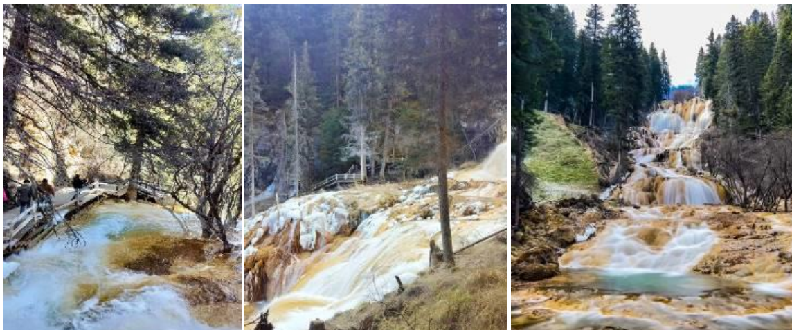
SBTTFU-SL003 เฉิงตู จิวจ้ายโกว โหมวหนิโกว ภูเขาสี่ดรุณี (นั่งรถไฟความเร็วสูง) 6วัน 5คืน โดยสายการบิน Lion Air (SL)

เช้า รับประทานอาหารเช้า ณ ห้องอาหารภายในโรงแรม (มื้อที่ 7)