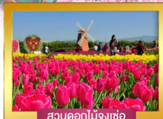
สวนดอกไม้จิ้งเซอ