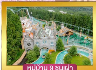
หมู่บ้าน 9 ชนเผ่า