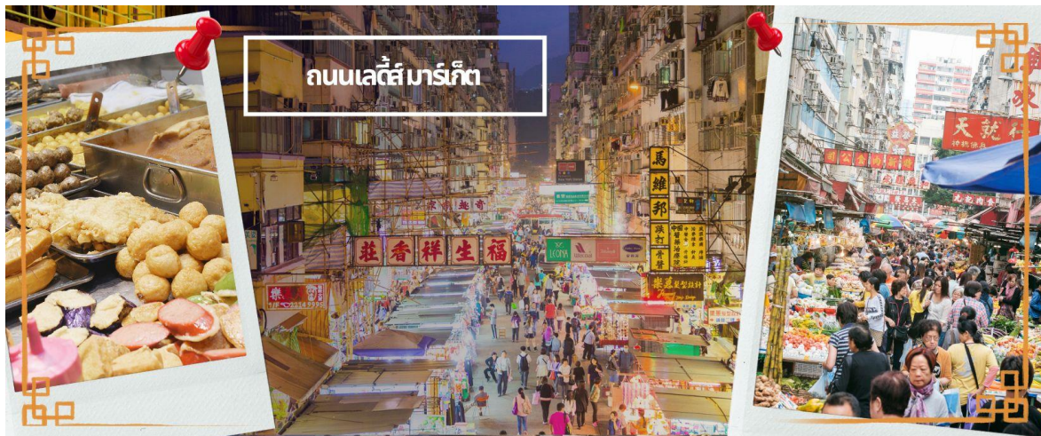
ถนนเลดี้ มาร์เก็ต

CFDHKG6 ช่องกง ดิสनीแลนด์ ซัฟปีง 3วัน2คืน FD (OCT-DEC24)