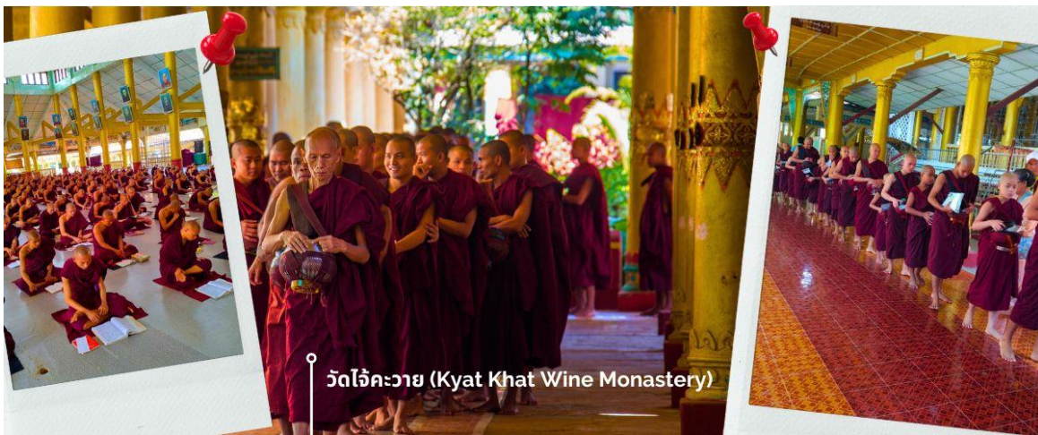
วัดไจ้คะวาย (Kyat Khat Wine Monastery)

นำท่านเดินทางลงจากพระธาตุนันทร์แขวน โดยใช้เส้นทางเดิม เพื่อมุ่งหน้าสู่เมืองหงสาวดี (ใช้เวลาเดินทางประมาณ 1 ชั่วโมง 30 นาที) เชิญร่วมทำบุญตักบาตรพระสงฆ์ ณ วัดไจ้คะวาย เมืองหงสาวดี มีพระสงฆ์กว่า 1000 รูป เป็นโรงเรียนสอนพระพุทธศาสนา นักรธรรมชั้นตรี โท และ เอก เพื่อศึกษาพระไตรปิฎกเป็นจำนวนมาก ในช่วงสายของทุกวัน พระสงฆ์และเณร จะเดินออกมาบิณฑบาตเพื่อเตรียมฉันเพล โดยวัดแห่งนี้ ได้รับความสนับสนุนจากชาวพุทธในพม่าเองและ นักท่องเที่ยวที่เดินทางมาที่วัด เพื่อทำการถวายเงินปัจจัย หรือ ข้าวสาร รวมไปถึง อุปกรณ์การเรียนและเครื่องเขียนต่างๆ เพื่อใช้ในการ ศึกษาธรรมะของพระสงฆ์และเณรในวัดไจ้คะวายแห่งนี้