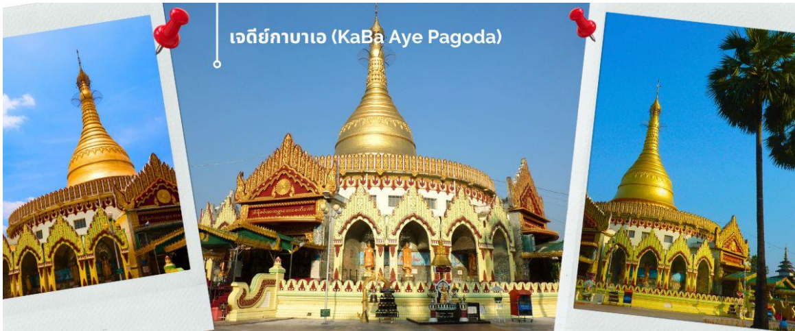
เจดีย์กาบาเอ (KaBa Aye Pagoda)

เที่ยง 🍲 รับประทานอาหารกลางวัน ณ ภัตตาคาร (7) เมนูพิเศษ!! เปิดปากกึ่ง+สลัดกุ้งมังกร จากนั้นนำท่าน เดินทางไปยัง เจดีย์กาบาเอ (KaBa Aye Pagoda) เพื่อร่วมพิธี เทินพระธาตุ พิธีอันศักดิ์สิทธิ์ เป็นเจดีย์ทรงกลมครึ่ง ซึ่งมีส่วนเข้าทั้งหมดห้าด้านด้วยกัน นายอุหนายกคนแรกของพม่า ได้สร้างขึ้นเพื่อใช้เป็นสถานที่ชำระพระไตรปิฎก สูง 34 เมตร สร้างขึ้นเมื่อปี 1952 เพื่อทำการสังคายนา พระไตรปิฎกครั้งที่ 6 เป็นเจดีย์ที่มีความสวยงามและแปลกตา ภายในบรรจุพระอัฐิธาตุของพระอัครสาวกแห่งองค์พระสัมมาสัมพุทธเจ้า คือพระโมคคัลลานะและพระสารีบุตร จะมีทางเข้าทั้งหมดห้าด้าน ทุกด้านมีพระพุทธรูปประดิษฐานอยู่บนฐานทักษิณ มีพระพุทธรูปหุ้มด้วยทองคำองค์เล็ก ๆ อีก 28 องค์ แทนอดีตสาวกของพระพุทธเจ้าทั้ง 28 องค์ ที่อุบัติขึ้นในโลกนี้ ส่วนพระพุทธรูปองค์พระประธานที่อยู่ข้างในหล่อด้วยเงินบริสุทธิ์มีน้ำหนัก กว่า 500 กิโลกรัม และ เข้าร่วมพิธีเทินพระธาตุเพื่อความเป็นสิริมงคล