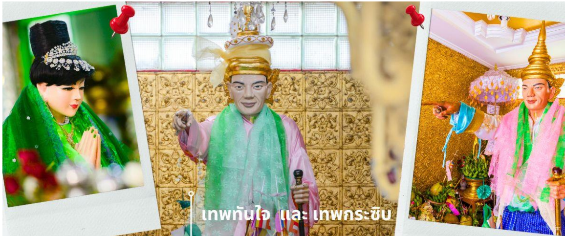
เทพทันใจ และ เทพกระซิบ

CBMR1 ย่างกุ้ง-หงสาว-พระธาตุนันทร์แขวน-เจดีย์กลางน้ำลิเรียม 3 วัน 2 คืน บิน 8M (SEP-MAR25)