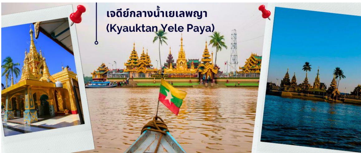
เจดีย์กลางน้ำเยเลพญา (Kyauktan Yele Paya)

นำท่านออกเดินทางสู่ เมืองลิเรียม (ใช้เวลาเดินทางประมาณ 45 นาที) ตาน-ลยิน หรือ เซียง ในอดีตไทยเรียก เลียง มีชื่อเดิมที่เป็นที่รู้จักกันโดยทั่วไปว่า ลิเรียม เป็นเมืองท่าสำคัญของภาคย่างกุ้ง ประเทศพม่า ตั้งอยู่ปากแม่น้ำอิรวดี อดีตเป็นเมืองท่าชั้นนอกของพะโคหรือหงสาวดี เคยเป็นที่มั่นของทหารโปรตุเกสที่ช่วยเหลือชาวมอญทำสงครามกับพม่าตั้งแต่คริสต์ศตวรรษที่ 16 เจดีย์กลางน้ำเยเลพญา (Kyauktan Yele Paya) เจดีย์นี้สร้างขึ้นบนเกาะกลางน้ำ เรียกอีกชื่อหนึ่งว่า “เจดีย์กลางน้ำ” เป็นที่สักการะของชาวลีเรียม ที่บริเวณท่าเทียบเรือบนเกาะ พร้อมนมัสการพระพุทธรูปทรงเครื่องจักรพรรดิเก่าแก่ ที่ประดิษฐานบนบัลลังก์ไม้แกะสลักปิดทองค่าเปลว ที่งดงามมีอายุนับพันปี ซึ่งเป็นที่สักการบูชาของชาวพม่าและชาวต่างชาติ