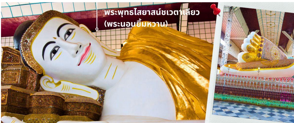
พระพุทธไสยาสน์ชเวตาเลียว (พระนอนอิมหวาน)

พระพุทธไสยาสน์ชเวตาเลียว เป็นปูชนียสถานศักดิ์สิทธิ์อันดับสองของเมืองหงสาวดี รองจากมหาเจดีย์มูเตตา หรือที่คนไทยรู้จักกันในชื่อ "พระนอนอิมหวาน" พระนอนชเวตาเลียว หรือ พระพุทธไสยาสน์ชเวตาเลียว มีอายุเก่าแก่กว่า ๑,๒๐๐ ปี คนไทยรู้จักในนาม พระนอนอิมหวาน เนื่องจากพระพักตร์ของท่านได้รับการวาดตกแต่งไว้อย่างสวยงามพร้อมด้วยรอยอิมหวาน องค์พระเป็นศิลปะแบบมอญท่านสามารถที่จะเลือกหา เครื่องไม้แกะสลัก ที่มีให้เลือกมากมาย ตลอดจนสองข้างทางที่จะเดินเข้าไปสักการะองค์พระนอน และสินค้าพื้นเมืองอื่นๆ อาทิเช่น ผ้าพม่า ของที่ระลึกต่างๆอีกมากมาย