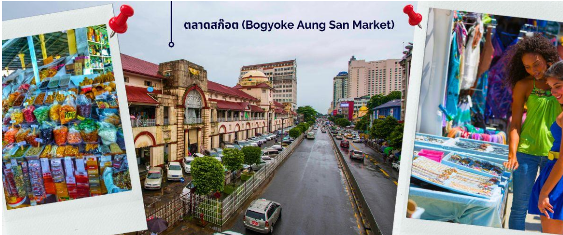
ตลาดสก๊อต (Bogyoke Aung San Market)

ให้ท่านได้มีเวลากับการเลือกซื้อของฝาก ของที่ระลึกต่างๆ ทั้งสินค้าพื้นเมืองที่มีชื่อเสียงของพม่าที่ ตลาดสก๊อต (Bogyoke Aung San Market) นี่คือนตลาดที่ใหญ่ที่สุดในย่างกุ้ง เป็นแหล่งช้อปปิ้งที่มีสินค้าวางขายแทบทุกชนิด เปรียบเสมือนตลาดนัดจตุจักรของบ้านเราก็ดูว่าได้ นอกจากสินค้าพื้นเมืองแล้ว ตลาดแห่งนี้ยังเป็นแหล่งรวมสินค้าประเภทอัญมณีที่เป็นที่รู้จักไปทั่วโลกนั่นคือ หยกพม่า (หากซื้อสินค้าหรืออัญมณีที่มีราคาสูงควรขอใบเสร็จรับเงินทุกครั้ง เนื่องจากจะต้องแสดงให้เห็นเจ้าหน้าทีศุลกากรหากมีการขอตรวจสอบ)