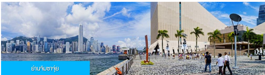
ย่านจิมซาจุ่ย