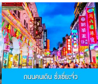
ถนนคนเดิน ช้างเซี่ยจิว