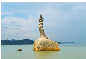
จูไห่เฟยเซอริเกิร์ล

พักที่ IRVINE HOLIDAY HTL OR HUICHANG HTL 3* หรือโรงแรมในระดับเดียวกันในเมืองจูไห่