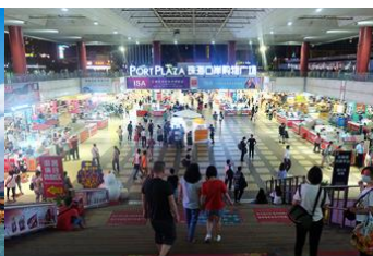
ตลาดใต้ดินกวงเป่ย์