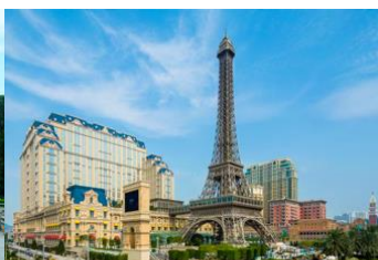
The Parisian Macao