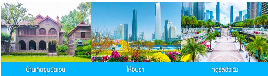
บ้านเกิดซุนยัตเซน

พักที่ IRVINE HOLIDAY HTL OR HUICHANG HTL 3* หรือโรงแรมในระดับเดียวกันในเมืองจูไห่