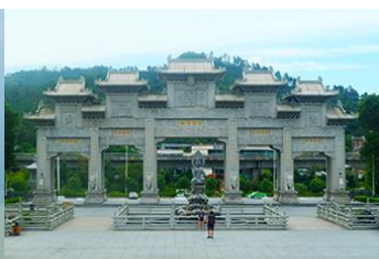
วัดฟูโกวฮ้อ