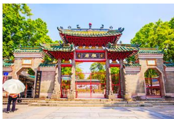
วัดจูเมี่ยว