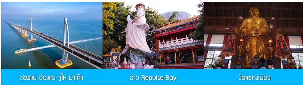
สะพาน ฮ่อมง จูไห่ มากี

นำคณะจีน Shuttle Bus ของโรงแรมเพื่อเดินทางไปด่านจูไห่ ผ่านพิธีการตรวจคนเข้าเมือง และนำท่านเดินทางสู่ที่พักในเมืองจูไห่ พักที่ IRVINE HOLIDAY HTL OR HUICHANG HTL 3* หรือโรงแรมในระดับเดียวกันในเมืองจูไห่