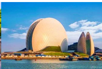
โรงละครจูไห่