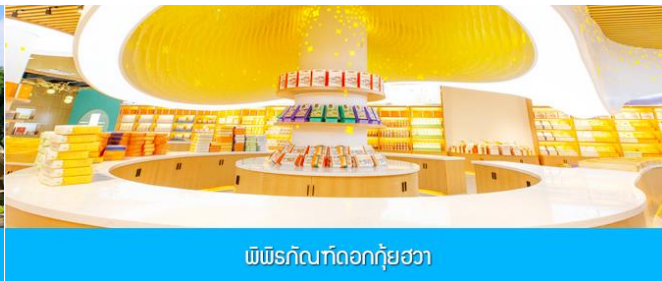
พิพิธภัณฑ์ดอกกุยฮวา