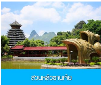
สวนหลิวซานเจีย