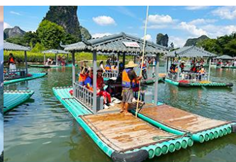
ขึ้นเรือแพชมแม่น้ำหลีเจียง