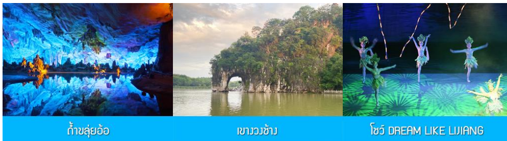
ถ้ำขลุ่ยอ้อ