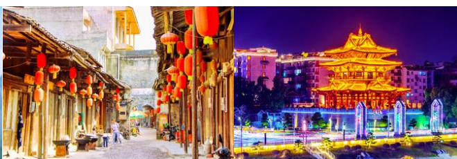
เมืองโบราณต้าชวี่