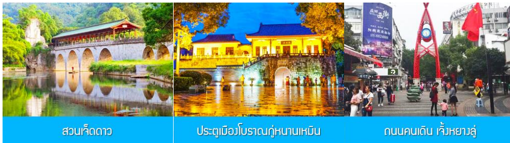
สวนเจ็ดดาว