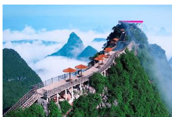
บันไดกระเช้าขึ้นเขาหญู่ฝ่ง

พักที่ YANGSHUO ELITE HOTEL ระดับ 4 ดาวท้องถิ่นหรือเทียบเท่าใน เมืองหยางชวี่