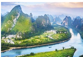
จุดชมวิวแม่น้ำหลีเจียงบนเขาซีงกง

พักที่ GUILIN VIENNA HOTEL ระดับ 4 ดาวท้องถิ่นหรือเทียบเท่าใน เมืองกุ้ยหลิน