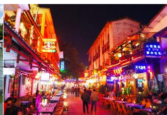
ถนนคนเดิน ซีเจียงหรือถนนฝรั่ง