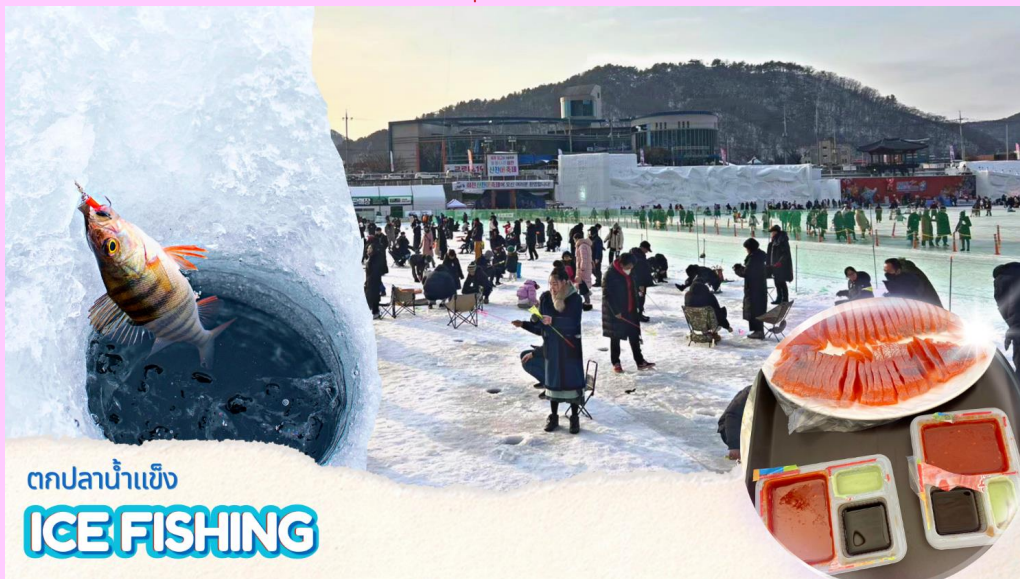
ตกปลาน้ำแข็ง ICE FISHING

(**รวมอุปกรณ์ตกปลาแบบเบสิค**) วิธีการตกปลา คือ หย่อนเหยื่อปลอม (ที่ทางเทศกาลเตรียมไว้ให้) ลงไปในรู จากนั้นก็กระตุกไม้เบ็ดตกปลาเบาๆ ให้เหมือนเหยื่อกำลังลอยไปลอยมาในน้ำ และปลาก็จะเข้ามากินเหยื่อ ง่ายๆเพียงแค่นี้ก็ทำให้ท่านตกปลาได้อย่างสนุกสนาน )