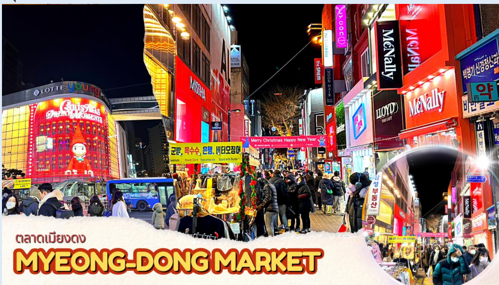
ตลาดเมียงดง MYEONG-DONG MARKET

จากนั้นนำท่านช้อปปิ้งย่าน เมียงดง หรือสยามสแควร์เกาหลี หากท่านต้องการทราบว่าแฟชั่นของเกาหลีเป็นอย่างไร ก้าวล้ำนำสมัยเพียงใดท่านจะต้องมาที่เมียงดงแห่งนี้ พบกับสินค้าวัยรุ่น อาทิ เสื้อผ้าแฟชั่นแบบอินเทรนด์ เครื่องสำอางต่างๆ ของเกาหลี พบกับความแปลกใหม่ในการช้อปปิ้งอีกรูปแบบหนึ่ง ซึ่งเมียงดงแห่งนี้จะมีวัยรุ่นหนุ่มสาวชาวโสมไปรวมตัวกันที่นี้กว่าล้านคนในแต่ละวัน