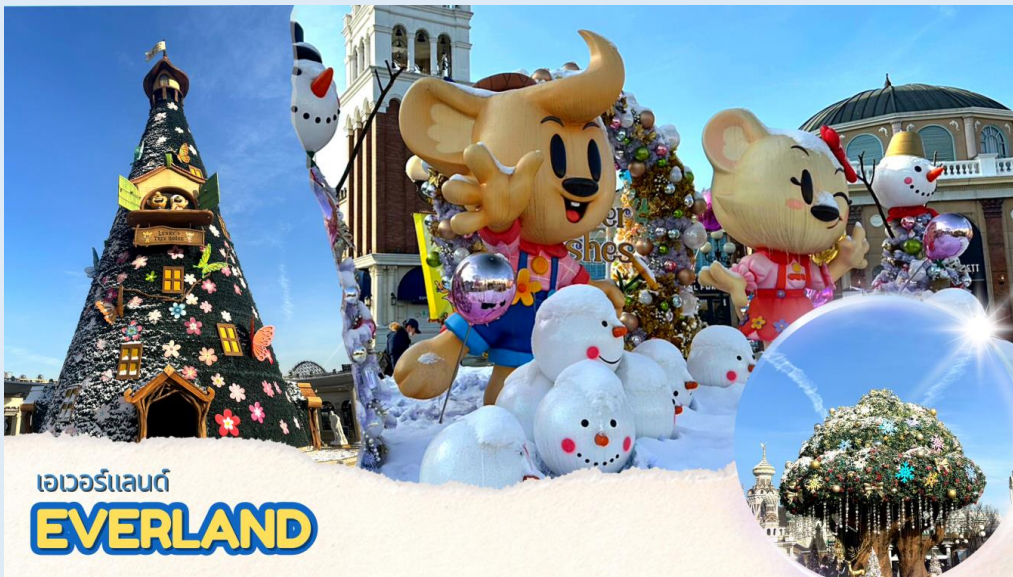
เอเวอร์แลนด์ EVERLAND

ซึ่งจะปลูกดอกไม้เปลี่ยนไปตามฤดูกาลและสนุกกับเครื่องเล่นนานาชนิด อาทิเช่น สเปสทัวร์ รถไฟเหาะ หนองสอาด ชมกิจกรรมและการแสดงต่าง ๆ ที่จัดตามตารางประจำวัน ด้วยบัตรเข้าชมแบบ Big 5 ซอบบิ่งในร้านค้าของที่ระลึกและ Outlet