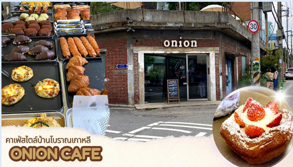
คาเฟ่สไตล์บ้านโบราณเกาหลี ONION CAFE

** ชำระค่าทัวร์ในนามบริษัท ไลออน ทราเวล จำกัด เท่านั้น **