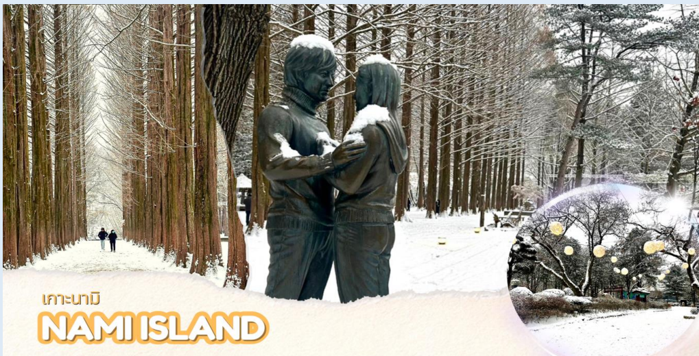
เกาะนามิ NAMI ISLAND

เรือเฟอร์รี่ข้ามไปโดยใช้เวลาประมาณ 10 นาที เกาะนามิ แหล่งท่องเที่ยวที่มีชื่อเสียงของเกาหลีใต้ที่สามารถท่องเที่ยวได้ทั้งปี ตั้งอยู่กลางทะเลสาบชองเพียง บนเกาะจะมีบรรยากาศร่มรื่นเต็มไปด้วยต้นสน ต้นเกาลัด ต้นแปะก๊วย ต้นซากุระ ต้นเมเปิ้ล และต้นไม้ดอกไม้อื่นๆที่ผลัดกันออกดอกเปลี่ยนสีให้ชมกันทุกฤดูกาล บรรยากาศหนาว มีหิมะปกคลุมก็จะอยู่ในช่วงเดือนธันวาคม-มกราคม เกาะนามิโด่งดังจาก ซีรีส์เรื่อง Winter Love song โดยใช้เกาะนามิเป็นสถานที่ถ่ายทำ มีคู่รักมากมายมักไม่พลาดที่จะมาถ่ายรูปกับจุดไฮไลต์บนเกาะสุดโรแมนติก Winter Sonata's First Kiss รูปปั้นคู่พระ-นาง จากซีรีส์เรื่องดัง ใกล้กันนั้นยังมีโซนอาหารทั้งร้านอาหารแบบนั่งทาน ร้านปิ้งย่าง และซาลาเปาหนึ่งเตาถ่านแบบโบราณ