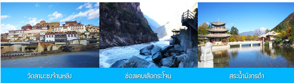
วัดลามะชวงจ้านหลิง