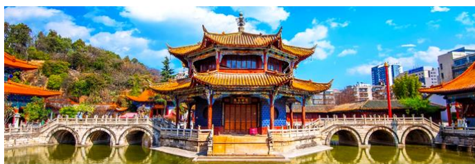
วัดหยวนกง