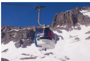
ภูเขาหิมะมังกรหยก (นั่งกระเช้าใหญ่)

ที่พัก FENG HUANG HOTEL ระดับ 4 ดาว หรือเทียบเท่าเมืองลี่เจียง