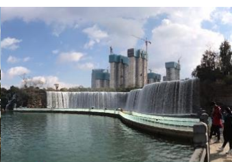
สวนน้ำตก Kunming Waterfall Park