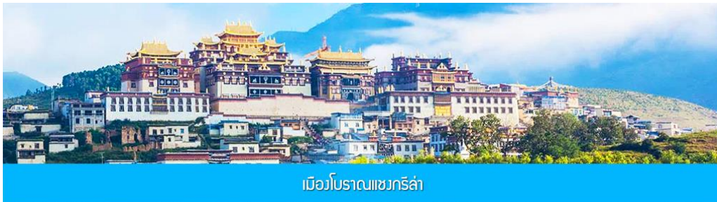
เมืองโบราณเซวกริล่า

จากนั้นนำท่านชม หมู่บ้านชีโจวหรือหมู่บ้านชาวป๋าย ชมพื้นเมืองที่สำคัญของเมือง ชมการแสดงของชนชาติป๋ายพร้อมชิมชาสามแก้ว เพื่อรำลึกถึงวิถีชีวิตและการเกิดมาเป็นมนุษย์ของตนเอง ซึ่งถือเป็นเอกลักษณ์ของชนชาวป๋าย ที่หาดูได้ยาก