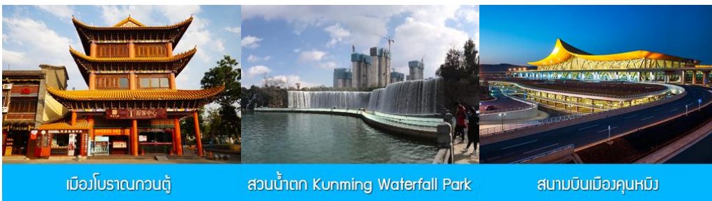
เมือโบราณกวนตุ๋

พักที่ FEI LONG HOTEL ระดับ 4 ดาว หรือเทียบเท่าในเมืองต้าหลี่