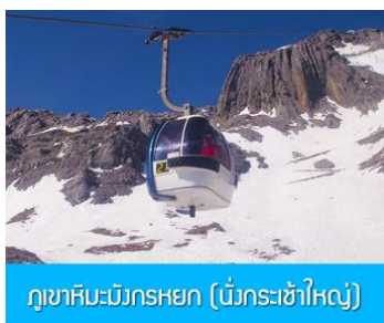
ภูเขาหิมะมังกรหยก (มังกรกระซำใหญ่)

ที่พัก FENG HUANG HOTEL ระดับ 4 ดาว หรือเทียบเท่าเมืองลี่เจียง