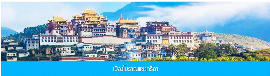
เมืองโบราณแซงกรี่ล่า

เช้า รับประทานอาหารเช้า ณ ห้องอาหารของโรงแรม รับประทานอาหารนำท่านชม เมืองโบราณแห่งต้าหลี่ สร้างขึ้นเมื่อกว่า 1,000 ปีก่อน สัมผัสบรรยากาศอันสงบเงียบของ เมืองไท่เหอ สองฟากของถนนสายเก่าแก่มีบ้านโบราณปลูกสร้างไว้อย่างกระจัดกระจาย มีถนนสายเก่าแก่ที่ตัดผ่านตัวเมือง โบราณสาขหนึ่งซึ่งทุกวันนี้ได้กลายเป็นถนนย่านการค้าที่เจริญคึกคัก ตามสองข้างถนนเต็มไปด้วยร้านค้าต่างๆ มีพ่อค้าชาวชนชาติไปที่แห่งชุกประจำชนชาติกำลังค้าขายสินค้าพื้นเมืองต่างๆ เช่น หินอ่อนต้าหลี่ ผ้าพื้นเมืองและเครื่องเงิน เป็นต้น จากนั้นนำท่านชม วัดเจ้าแม่กวนอิมแปลงกาย เป็นวัดที่มีประติมากรรมเชื่อมยอดและมีชื่อเสียงของเมืองต้าหลี่ จากตำนานโบราณเล่าขานกันว่าในสมัยราชวงศ์ถัง เจ้าแม่กวนอิมได้แปลงร่างเป็นหญิงชราอายุกว่า 80 ปี แยกก้อนหินใหญ่ไว้ข้างหลัง ยืนกีดขวางทางทหารไม่ให้เดินทางเข้ามาตีเมืองได้ เมื่อทหารของฝ่ายศัตรูได้เห็นว่าแม่แต่หญิงชราขี้แก่แข็งแรงถึงเพียงนี้ ถ้าเป็นคนวัยหนุ่มสาวจะต้องมีพลังกำลังมากมายจะต่อสู้ จึงไม่ได้ทำการเข้าโจมตีเมืองและถอยทัพกลับไป ชาวเมืองต้าหลี่จึงร่วมใจกันสร้างวัดนี้ขึ้นเพื่อสักการะและรำลึกถึงพระคุณของเจ้าแม่กวนอิมและกลายเป็นสัญลักษณ์ของเมืองต้าหลี่อีกด้วย เที่ยง รับประทานอาหารกลางวัน ณ ภัตตาคาร จากนั้นนำท่านชม หมู่บ้านซีโจวหรือหมู่บ้านชาวปี้ ชนพื้นเมืองที่สำคัญของเมือง ชมการแสดงของชนชาติปี้พร้อมชิมชาสามแก้ว เพื่อรำลึกถึงวิถีชีวิตและการเกิดมาเป็นมนุษย์ของตนเอง ซึ่งถือเป็นเอกลักษณ์ของชนชาวปี้ ที่หาดูได้ยาก