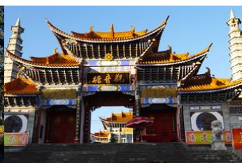
วัดเจ้าแม่กวนอิมเปล่งกาย