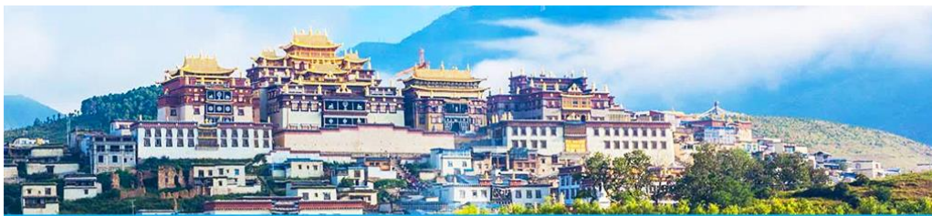
เมืองโบราณเซวกริล่า

จากนั้นนำท่านเดินทางสู่ เมืองเจตียน โดยใช้เส้นทางด่วนวิ่งตรงเข้าเมือง เจตียน ใช้เวลาเดินทางประมาณ 2 ชั่วโมง สู่ เมืองเจตียน หรือดินแดนแห่งเซวกริล่า ซึ่งอยู่ทางทิศตะวันออกเฉียงเหนือของมณฑลยูนนานซึ่งมีพรมแดนติดกับอาณาเขตน่านซี ของเมืองลี่เจียง และอาณาจักรหิ ของเมืองหนิงหลง สถานที่แห่งนี้จึงได้ชื่อว่า ดินแดนแห่งความฝัน