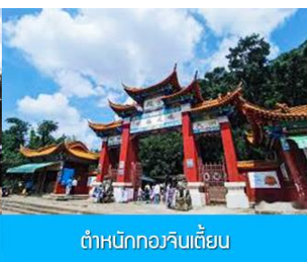
ตำหนักกวงจิ้นเตียน