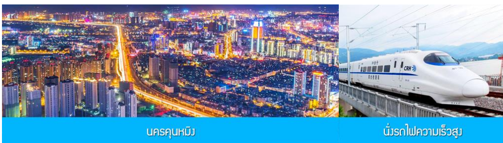
นครคุนหมิง