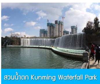
สวนน้ำตก Kunming Waterfall Park

พักที่ VIENNA HOTEL ระดับ 4 ดาว หรือเทียบเท่าในเมืองคุนหมิง