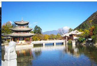
สระน้ำบึงกรด้า

วันที่สาม เจตียน-วัดลามะชวงจ้านหลิง-ช่องแคบเสือกะโจน-ลี่เจียง-สระม้งกรด้า-เมืองโบราณลี่เจียง