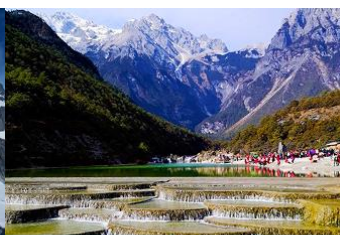
หุบเขาพระจันทร์สีน้ำเงิน "ปู้สุ่ยเหอ"

วันที่สี่ ภูเขาหิมะมังกรหยก (รวมนั่งกระเช้าใหญ่ขึ้นลง)- หุบเขาพระจันทร์สีน้ำเงิน-น้ำตกปู้สุ่ยเหอ ออฟชั่น ไกด์ชาวจีนรถอล์ฟ ท่านละ 80 หยวน โชว์ IMPRESSION LIJIANG- อุทยานน้ำหยก -ต้าหลี่