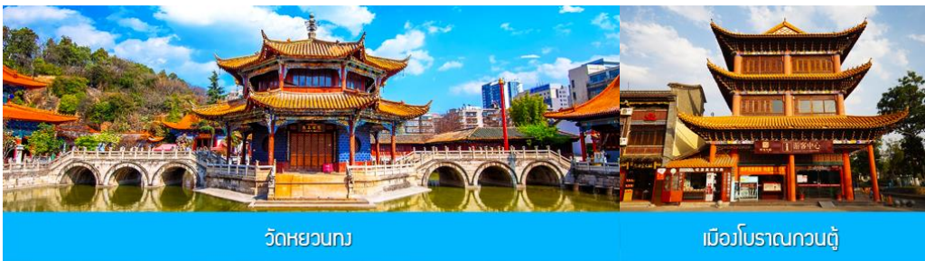
วัดหยวนกวง

พักที่ FEI LONG HOTEL ระดับ 4 ดาว หรือเทียบเท่าในเมืองต้าหลี่