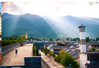
หมู่บ้านซีโจว(หมู่บ้านชาวปื)