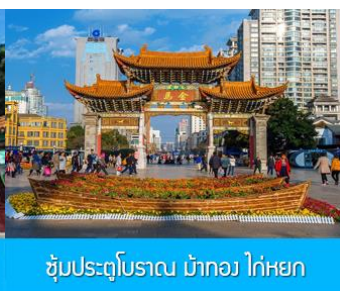
ขุมประตูปราณ บ้าทอว ไก่หยก

วันที่หก คุนหมิง - KUNMING WATERFALL PARK - ตำหนักกวงจิ้นเตียน - ขุมประตูปราณ ม้าทอว ไก่หยก - ร้าน POP MART (ตามหาบูมบี้) - กรุงเทพฯ (สุวรรณภูมิ)