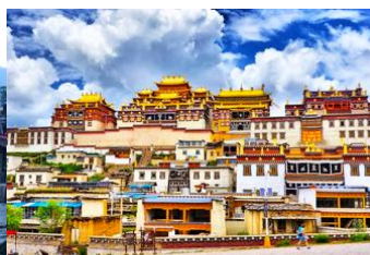
เมืองเซงการีล่า