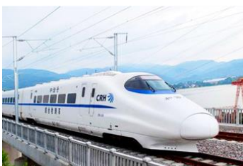
บริการรถไฟความเร็วสูง

พักที่ JINHUA HOTEL ระดับ 4 ดาวหรือเทียบเท่าในเมืองคุนหมิง