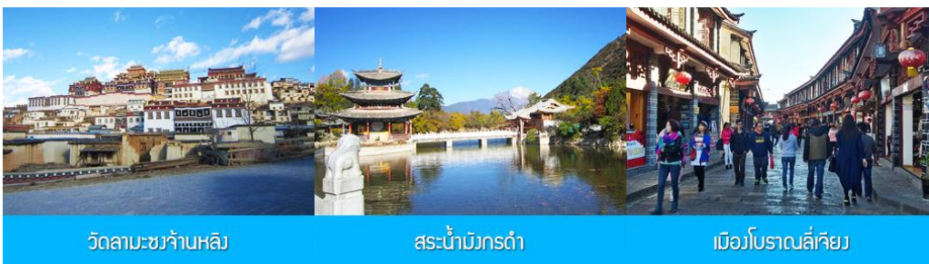
วัดลามะชวงจันหลิง

ที่พัก YUE GUANG HOTEL ระดับ 4 ดาว หรือเทียบเท่าเมืองจางเตี้ยน หรือเซงกักรี่ล่า