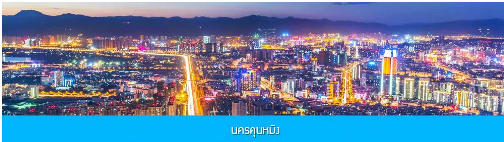
นครคุนหมิง