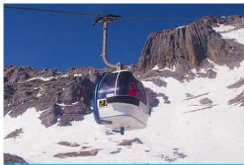
ภูเขาหิมะมังกรหยก (บ่อน้ำร้อนใหญ่)

ที่พัก FENG HUANG HOTEL ระดับ 4 ดาว หรือเทียบเท่าเมืองลี่เจียง