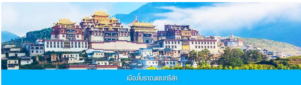
เมืองโบราณเซวกริล่า

หมายเหตุ การเที่ยวชมอุทยานช่องแคบเสือกะโจน สามารถเที่ยวได้ด้วยการบินลง และขึ้นบันไดจากบริเวณลานจอดรถลงไปยังจุดชมวิวยุคใหม่ที่อยู่ด้านล่าง (บันไดราว 430 ขั้น) หรือท่านสามารถซื้อตั๋วบันไดเลื่อนในราคา 70 -100 หยวนรวมขาลงและขาขึ้น ( โดยราคา 70 หยวนจะมีเฉพาะช่วงที่มีโปรโมชันเท่านั้น) ค่าทัวร์ของเราได้รวมค่าเข้าชมอุทยานเสือกะโจน แต่ยังไม่รวมค่าบันไดเลื่อน หากท่านต้องการซื้อตั๋วบันไดเลื่อน ท่านสามารถแจ้งความประสงค์กับไกด์ท้องถิ่นเพื่อให้ไกด์ดำเนินการจองตั๋วแบบหมู่คณะล่วงหน้า