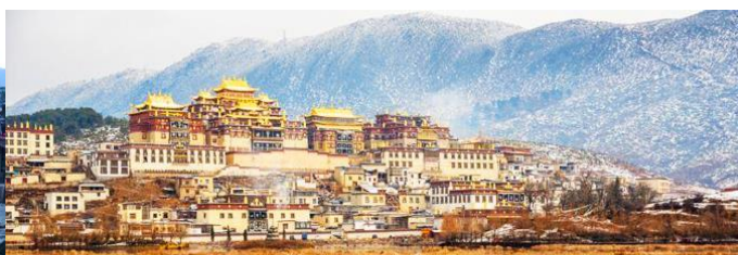
เมืองโบราณแซงการีล่า