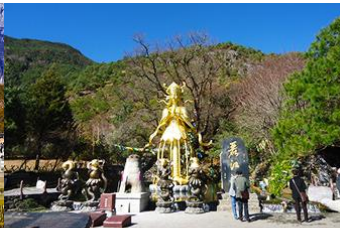
อุทยานน้ำหยก

วันที่ดี ภูเขาหิมะมังกรหยก (รวมนั่งกระเช้าใหญ่ขึ้นลง)– หุบเขาพระจันทร์สีน้ำเงิน-น้ำตกไป๋ส่วยเหอ ออฟชั่น ไกด์ชาวรถกอล์ฟ ท่านละ 80 หยวน โชว์ IMPRESSION LIJIANG- อุทยานน้ำหยก -ต้าหลี่