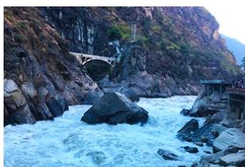
ช่องแคบเล็กระโจน

พักที่ WEN DING HOTEL ระดับ 4 ดาวหรือเทียบเท่า