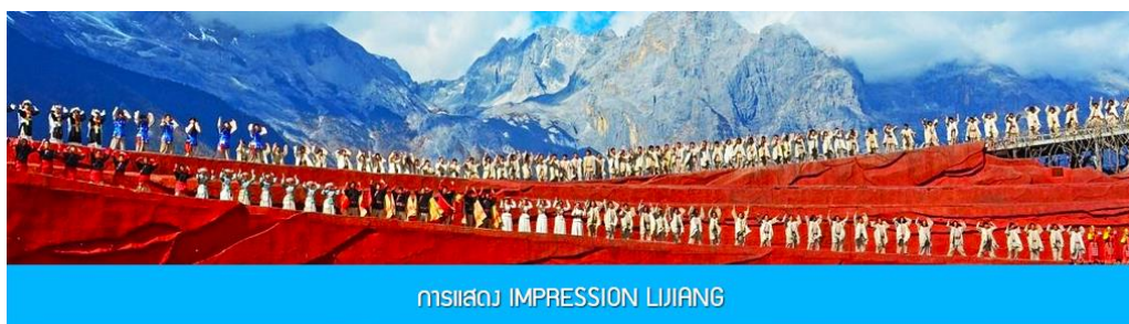
การแสดง IMPRESSION LIJIANG

หลังอาหารนำท่านชมการแสดง IMPRESSION LIJIANG โชว์อันยิ่งใหญ่โดยผู้กำกับชื่อก้องโลก "จาง อี้โหมว" ได้เนรมิต ให้ภูเขาหิมะมังกรหยกเป็นฉากหลัง และบริเวณทุ่งหญ้าเป็นเวทีการแสดง โดยใช้นักแสดงกว่า 600 ชีวิต แสง สี เสียง การแต่งกายตระการตา เล่าเรื่องราวชีวิตความเป็นอยู่ และชาวเผ่าต่างๆของเมืองลี่เจียง