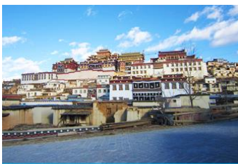
วัดลามะชวงจ้านหลิง