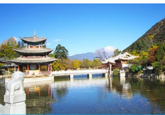
สระน้ำมังกรดำ