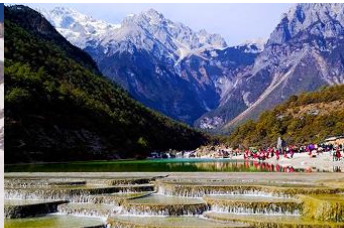
หุบเขาพระจันทร์สีน้ำเงิน "ไป๋ส่วยเหอ"