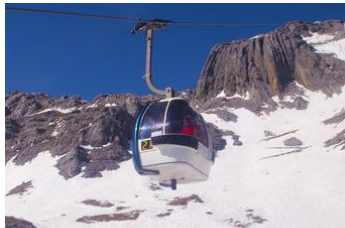
ภูเขาหิมะมังกรหยก (นั่งกระเช้าใหญ่)

ที่พัก FENG HUANG HOTEL ระดับ 4 ดาว หรือเทียบเท่าเมืองลี่เจียง