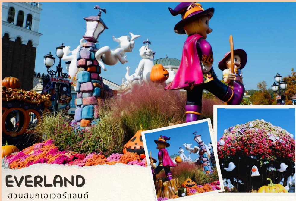
EVERLAND สวนสนุกเอเวอร์แลนด์

นำท่านไปสนุกสุดมันส์ที่ สวนสนุกเอเวอร์แลนด์ Everland เป็นสวนสนุกกลางแจ้งของประเทศเกาหลีใต้ สวนสนุกนี้ถูกขนานนามว่า ดิสนีย์แลนด์เกาหลี เป็นสวนสนุกกลางแจ้งที่ใหญ่ที่สุดของประเทศ โดยมีบริษัทซัมซุงเป็นเจ้าของ ตั้งอยู่ท่ามกลางหุบเขา ท่านจะได้นั่งกระเช้าลิฟต์ และท่องไปกับโลกของสัตว์ป่าซาฟารี เข้าสู่ดินแดนแห่งเทพนิยาย สวนสี่ฤดู ซึ่งจะปลูกดอกไม้เปลี่ยนไปตามฤดูกาลและสนุกกับเครื่องเล่นนานาชนิด อาทิ เช่น สเปนทัวร์ รถไฟเหาะ หนองสะบัด ชมกิจกรรมและการแสดงต่าง ๆ ที่จัดตามตารางประจำวัน ด้วยบัตรเข้าชมแบบ Big 5 ช้อปปิ้งในร้านค้าของที่ระลึกและ Outlet