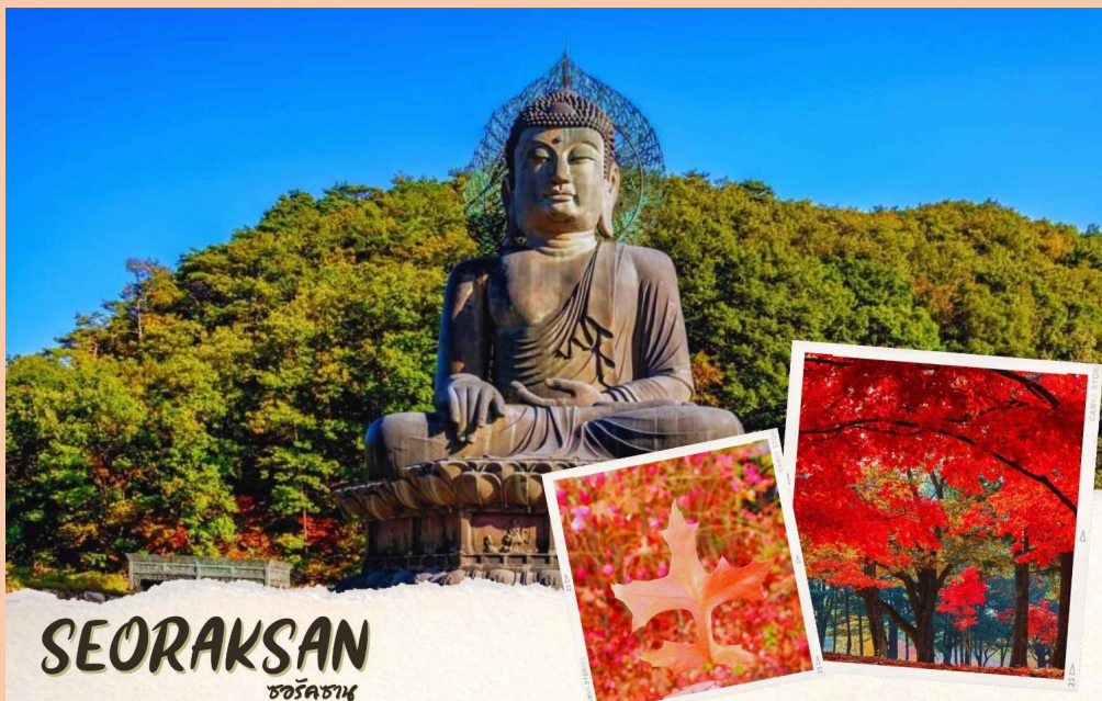
SEORAKSAN ซอรัคซาน

ซึ่งเกิดขึ้นเองตามธรรมชาติที่หาดูธรรมชาติที่หาดูได้ยากยิ่ง ตามรอยตำนานที่เล่าขานของจุดกำเนิดเพลงอารีริงกูเขาซอรัคซานมีความงามเฉพาะตัวตลอดปีอยู่แล้ว แต่ช่วงฤดูใบไม้เปลี่ยนสีจะเป็นช่วงที่งดงามที่สุดนักท่องเที่ยวจะชอบเดินทางกันในช่วงนี้ เพื่อชมความงามของใบไม้สีต่างๆ ประมาณเดือนตุลาคม ทั่วทั้งบริเวณใบไม้จะกลายเป็นสีแดงและสีเหลือง