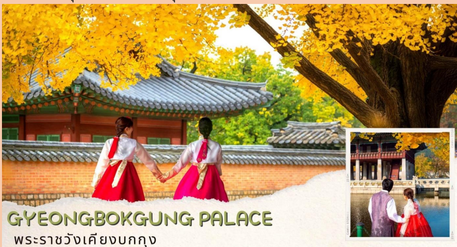
GYEONGBOKGUNG PALACE พระราชวังเคียงบกกุง

นำท่านเดินทางสู่ ศูนย์โสมรัฐบาล ซึ่งรัฐบาลรับรองคุณภาพว่าผลิตจากโสมที่มีอายุ 6 ปีซึ่งถือว่าเป็นโสมที่มีคุณภาพดีที่สุดในวงจรชีวิตของโสมพร้อมให้ท่านได้เลือกซื้อโสมที่มีคุณภาพดีที่สุดในราคาถูกกว่าไทยถึง 2 เท่ากลับไปบำรุงร่างกายหรือฝากญาติผู้ใหญ่ที่ท่านรักและนับถืออีกไม่ไกลจากกันมากนัก จากนั้นนำท่านเรียนรู้วิธีการทำ คิมบับ(ข้าวห่อสาหร่าย) อาหารง่าย ๆ ที่คนเกาหลีนิยมรับประทานโดยการนำข้าวสุกและส่วนผสมอื่น ๆ หลากชนิด เช่น แดงกวา แครอท ผักโขม ไข่เจียว ปูอัด แฮม เป็นต้น แล้วแต่วัตถุดิบที่ท่านสะดวกวางแผนบนแผ่นสาหร่ายแล้วม้วนเป็นแท่งยาวๆ จากนั้นหั่นเป็นชิ้นพอดีคำ ชาวเกาหลีนิยมรับประทานคิมบับระหว่างการปิกนิก หรืองานกิจกรรมกลางแจ้ง หรือรับประทานเป็นอาหารกลางวันเบาๆ โดยเสิร์ฟกับหัวไชเท้าดองและกิมจิ นอกจากนี้คิมบับยังเป็นอาหารนำกลับบ้านที่เป็นที่นิยมทั้งในเกาหลีและต่างประเทศ จากนั้นพาท่านไป ศูนย์สมุนไพรสนเข็มแดง (RED PINE) เป็นผลิตภัณฑ์ ที่สกัดจากน้ำมันสน มีสรรพคุณช่วยบำรุงร่างกายลดไขมัน ช่วยควบคุมอาหารและรักษาสสมดุลในร่างกายได้เป็นอย่างดี