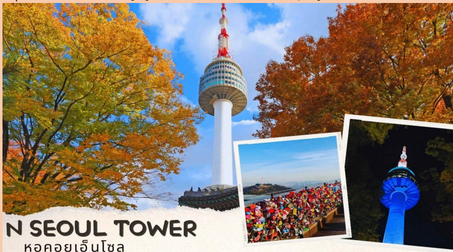
N SEOUL TOWER หอคอยเอ็นโซล

หลังจากนั้น นำท่านไปช้อปปีงที่ ศูนย์รวมเครื่องสำอางแบรนด์ดังเกาหลี (COSMETIC SHOP) เช่น WATER DROP (ครีมหน้าแตก) , SNAIL CREAM (ครีมเมือกหอยทาก) , BOTOX (โบท็อกซ์) , ALOE VERA PRODUCT (ผลิตภัณฑ์จากสมุนไพร ว่านหางจระเข้) เป็นต้นหลังทานอาหารเย็น จากนั้นนำท่านสู่ หอคอยกรุงโซล Tower (ไม่รวมค่าลิฟต์) ซึ่งอยู่บริเวณเนินเขานัมซานซึ่งเป็น 1 ใน 18 หอคอยที่สูงที่สุดในโลกที่ฐานของหอคอยมีสิ่งที่น่าสนใจต่าง ๆ เช่นศาลาแปดเหลี่ยมปาลกักจอง, สวนสัตว์เล็ก ๆ, สวนพฤกษชาติ, อาคารอนุสรณ์ผู้รักชาติอันสูงกุน อีสระให้ทุกท่านได้เดินเล่นและถ่ายรูปคู่หอคอยตามอัธยาศัยหรือคล้องกัญญ์คูร์ก