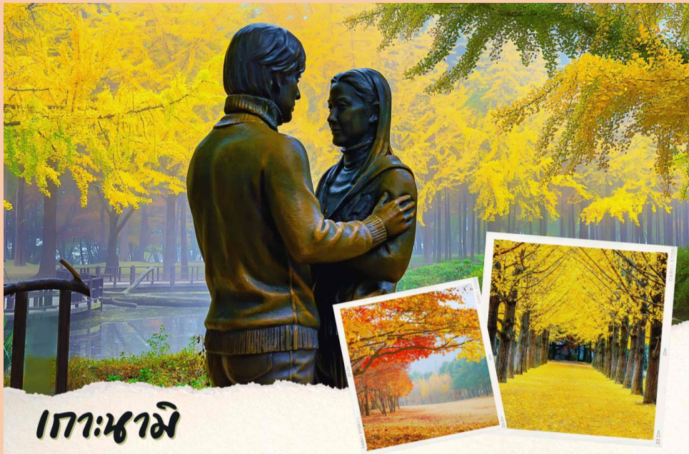
เกาะนามิ

จากนั้นนำท่านสู่เมืองซุนซอน ลงเรือเดินทางสู่ เกาะนามิ โดยใช้เวลาประมาณ 10 นาที ชมวิว ทิวทัศน์ของสถานที่เคยใช้เป็นสถานที่ถ่ายทำซีรีส์ Winter Love Song อันโด่งดังไปทั่วเอเชีย พร้อมมีเวลาให้ท่านได้เก็บภาพอันสวยงามน่าประทับใจสุดแสนโรแมนติกเปรียบประหนึ่งดูจท่านเป็นพระ-นาง ในละครเลยทีเดียว อีสระถ่ายรูปตามอัธยาศัย