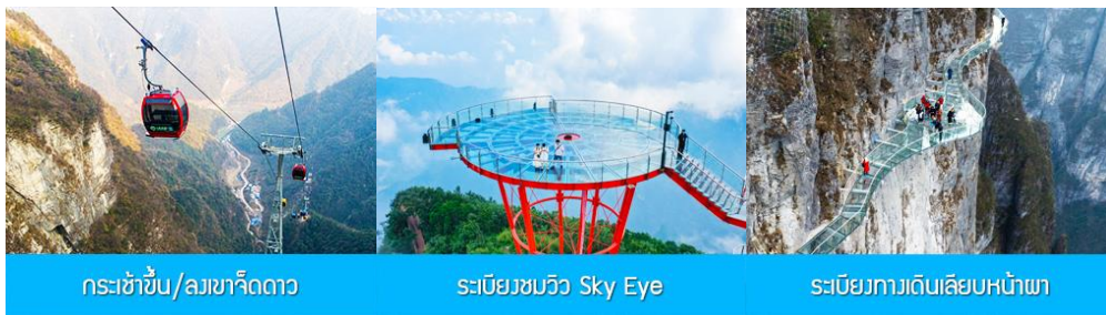
กระเช้าขึ้น/ลงเขาเจ็ดดาว