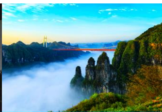
อุทยานป่าไม้แห่งชาติไ้อ้าย