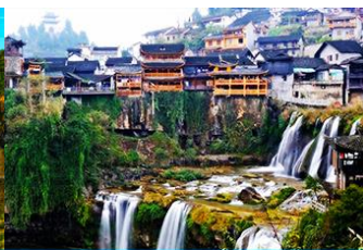
เมืองโบราณฝูหรงเงิน