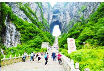
บันได 999 ขั้น