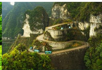
เส้นทาง 99 โค้ง

จากนั้นนำท่านสู่ โพรงประตูสวรรค์ 天门洞 โดย บันไดเลื่อนที่สร้างขึ้นโดยการเจาะทะลุภูเขา 穿山手扶梯 มีความสูงถึง 7 ชั้น เป็นสิ่งอำนวยความสะดวกใหม่ล่าสุดของ เขาเทียนเหมิน ซึ่งหาดูได้ยากตามแหล่งท่องเที่ยวต่างๆ ทั่วโลก บริเวณนี้ ท่านจะได้ถ่ายภาพ ประตูลูกศร อย่างใกล้ชิด โดยในปี 1990 มีนักบินผาดโผนชาวรัสเซียขับเครื่องบิน 3 ลำบินลอดผ่านช่องโพรงหินประตูลูกศรแห่งนี้พร้อมกัน ภาพประวัติศาสตร์นี้ถูกบันทึกและเผยแพร่ไปทั่วโลก ภูเขาเทียนเหมินซานจึงเป็นที่รู้จักของนักผจญภัยทั่วโลกที่อยากเดินทางมาสัมผัสด้วยตัวเอง.... จากนั้นท่านสามารถทดสอบกำลังขาของท่าน โดยการเดินลงบันได 999 ขั้น เพื่อลงมายังลานกว้างที่เป็นจุดถ่ายรูปด้านล่างของประตูลูกศร ท่านที่ไม่ต้องการการเดินบันไดลง สามารถใช้บันไดเลื่อนแทนการเดินลงบันได 999 ขั้น ณ ลานกว้างด้านล่างเป็นจุดถ่ายรูปที่ดีที่สุดที่สามารถมองเห็นเขาประตูลูกศรได้อย่างชัดเจน จากนั้นนำท่านนั่งกระเช้าลงจากเขาเทียนเหมินซาน