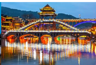
สะพานหวงเฉียว