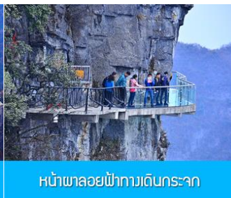
หน้าผาลอยฟ้ากางเดินกระาะ