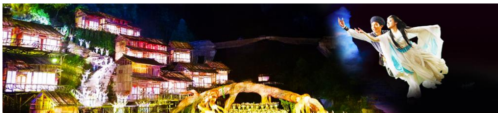
The Love Story of a Wooden Man and Fairy fox

** บันไดเลื่อนทะลุภูเขาจะปิดให้บริการในช่วงเดือนธันวาคม - เดือนกุมภาพันธ์ ของทุกปี ด้วยเหตุผลด้านความปลอดภัย เนื่องจากเป็นช่วงที่มีหิมะปกคลุมในบางจุด และเส้นทางซึ่งทำให้ไม่สามารถใช้สัญจรได้ ในส่วนที่เป็นกระเช้าขึ้น/ลงเขายังคงเปิดให้บริการตามปกติในฤดูหนาว**