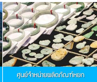
ศูนย์จำหน่ายผลิตภัณฑ์หยก