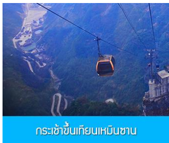
กระเช้าขึ้นเขายานเหมินซาน

โรงแรมระดับ 4 ดาวท้องถิ่นหรือเทียบเท่าในเมืองฟงหวง