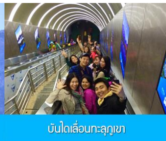
บันไดเลื่อนทะลุภูเขา

วันที่ห้า เมืองโบราณฟงหวง-เมืองจางเจียเจีย-ศูนย์ผลิตภัณฑ์ยางพารา- กระเช้าขึ้นเขายานเหมินซาน ระเบียบแก้วเลียบนหน้าผา - บันไดเลื่อนทะลุภูเขา - (เลือกซื้อโปรแกรมเสริม โชว์ / จิ้งจอกขาว หรือ แม่ลิ้เชียงซี)