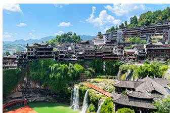
เมืองโบราณฝูหรงเจิ้น

https://hk.trip.com/hotels/guzhang-hotel-detail-68614854/chaxitai-holiday-hotel/