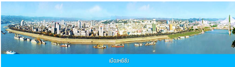
เมืองหยี่ชัง