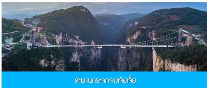
สะพานกระจกจางเจียเจียะ

อัตราค่าบริการสำหรับโปรแกรมเสริมการแสดงชุด The love Story of Wooden man and Fairy Fox ท่านละ 400 หยวน (หรือ 2,000 บาทขึ้นอยู่กับอัตราแลกเปลี่ยน) ระยะเวลาที่ใช้ในการเที่ยวชมการแสดง ประมาณ 3 ชั่วโมง รวมเวลาเดินทางไป กลับค่าบริการรวม ค่าบัตรเข้าชม ค่ารถรับ ส่ง และค่าน้ำทิพย์ของไกด์ท้องถิ่นพักที่ GUIYUANZHENPIN HOTEL โรงแรมระดับ 4 ดาวหรือเทียบเท่า