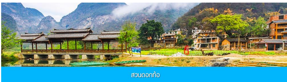
สวนดอกท้อ