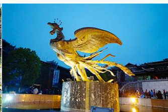
เมืองโบราณฟิงหวง