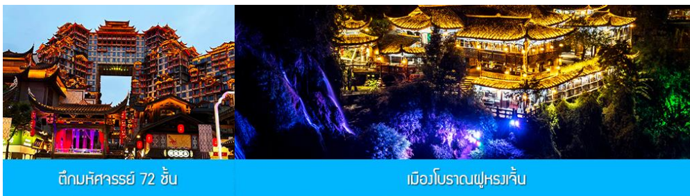
ตึกหิคารร์ยี่ 72 ชั้น

พักที่ YICHANG MELJI BOYUE HOTEL โรงแรมระดับ 4 ดาวหรือเทียบเท่าในเมืองหยี่ชัง