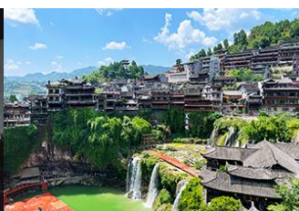
เมืองโบราณฟูหยวนจั้น