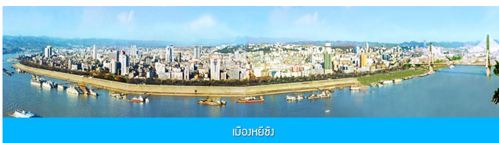
เมืองหยี่ฮ้าง