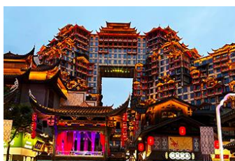
ตึกมหิศวรรษย์ 72 ชั้น

พักที่ CHANGDE YUNXI HOTEL ระดับ 4 ดาวห้องถื่น หรือเทียบเท่าในเมืองฉางเต๋อ