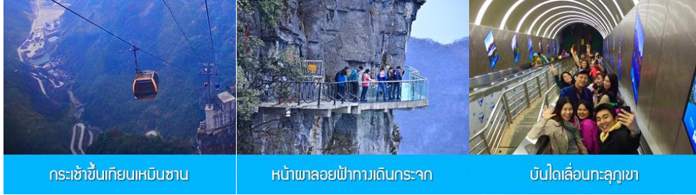
กระเช้าขึ้นเขายเทียนเหมินซาน

https://hk.trip.com/hotels/guzhang-hotel-detail-68614854/chaxitai-holiday-hotel/