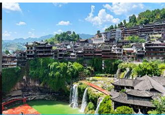
เมืองโบราณฟูหยวนจิ้น