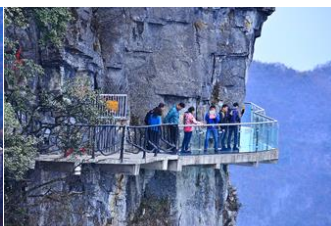
หน้าผาลอยฟ้าทางเดินกระจก