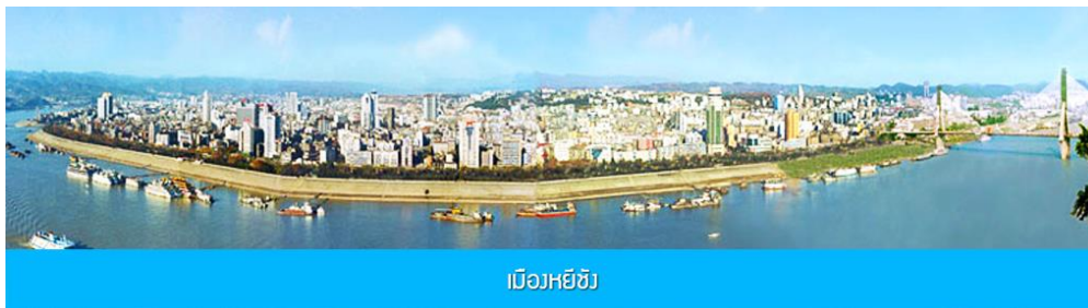
เมืองหยี่ฮวง