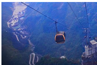
กระเช้าขึ้นเขเทียนเหมินซาน