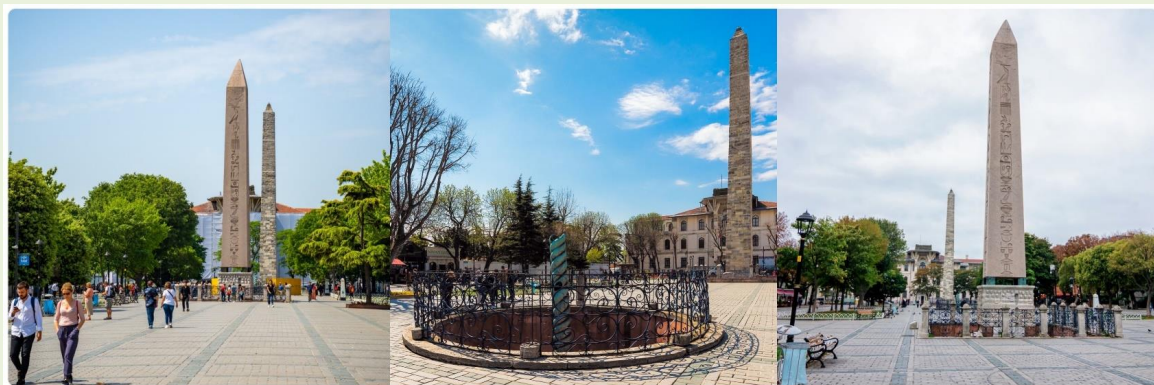
หน้า 13 (ภาพใช้เพื่อการโฆษณาเท่านั้น)

จากนั้นนำทุกท่านสู่ จัตุรัสสุลต่านอะห์เมตหรือฮิปโปโดรม (HIPPODROME) สนามแข่งม้าของชาวโรมัน จุดศูนย์กลางแห่งการท่องเที่ยวเมืองเก่า สร้างขึ้นในสมัยจักรพรรดิ เซปติมิอุสเซเวอรัสเพื่อใช้เป็นที่แสดงกิจกรรมต่างๆของชาวเมือง ต่อมาในสมัยของจักรพรรดิคอนสแตนตินฮิปโปโดรมได้รับการขยายให้กว้างขึ้นตรงกลางเป็นที่ตั้งแสดงประติมากรรมต่าง ๆซึ่งส่วนใหญ่เป็นศิลปะในยุคกรีกโบราณในสมัยออตโตมันสถานที่แห่งนี้ใช้เป็นที่จัดงานพิธีแต่ในปัจจุบันเหลือเพียงพื้นที่ลานด้านหน้ามัสยิดสุลต่านอะห์เมตซึ่งเป็นที่ตั้งของเสาโอเบล